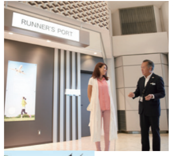
仙台空港の ランナーズポート ロッカー、シャワーなど が完備。ランナー向けの コースマップも掲出さ れています。

さん。ご主人も満面の笑みで 「もつと食べて」「ご苦労もあつ たでしょうに、皆さん笑顔で本当 に良かった。リピートします！」。