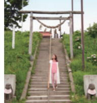
日和山（名取市） 東北・みやぎ復興マラソ ンでは、この辺りが折 返し地点になる予定。