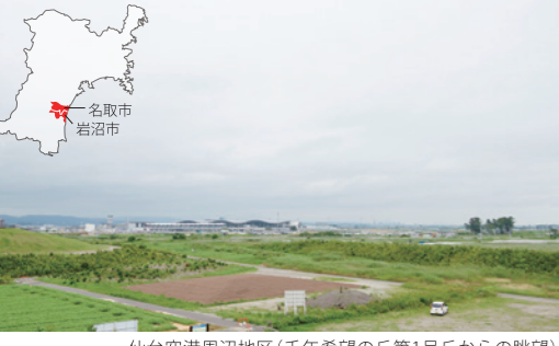
仙台空港周辺地区（千年希望の丘第1号丘からの眺望）

東日本大震災の記録・記憶の 伝承と、防災学習および植 樹・育樹などの環境保全活動 による交流の拠点として、千 年希望の丘（相野釜公園内） に整備。岩沼市の被災状況や 復旧復興の取り組みを、パ ネルと映像で紹介しています。