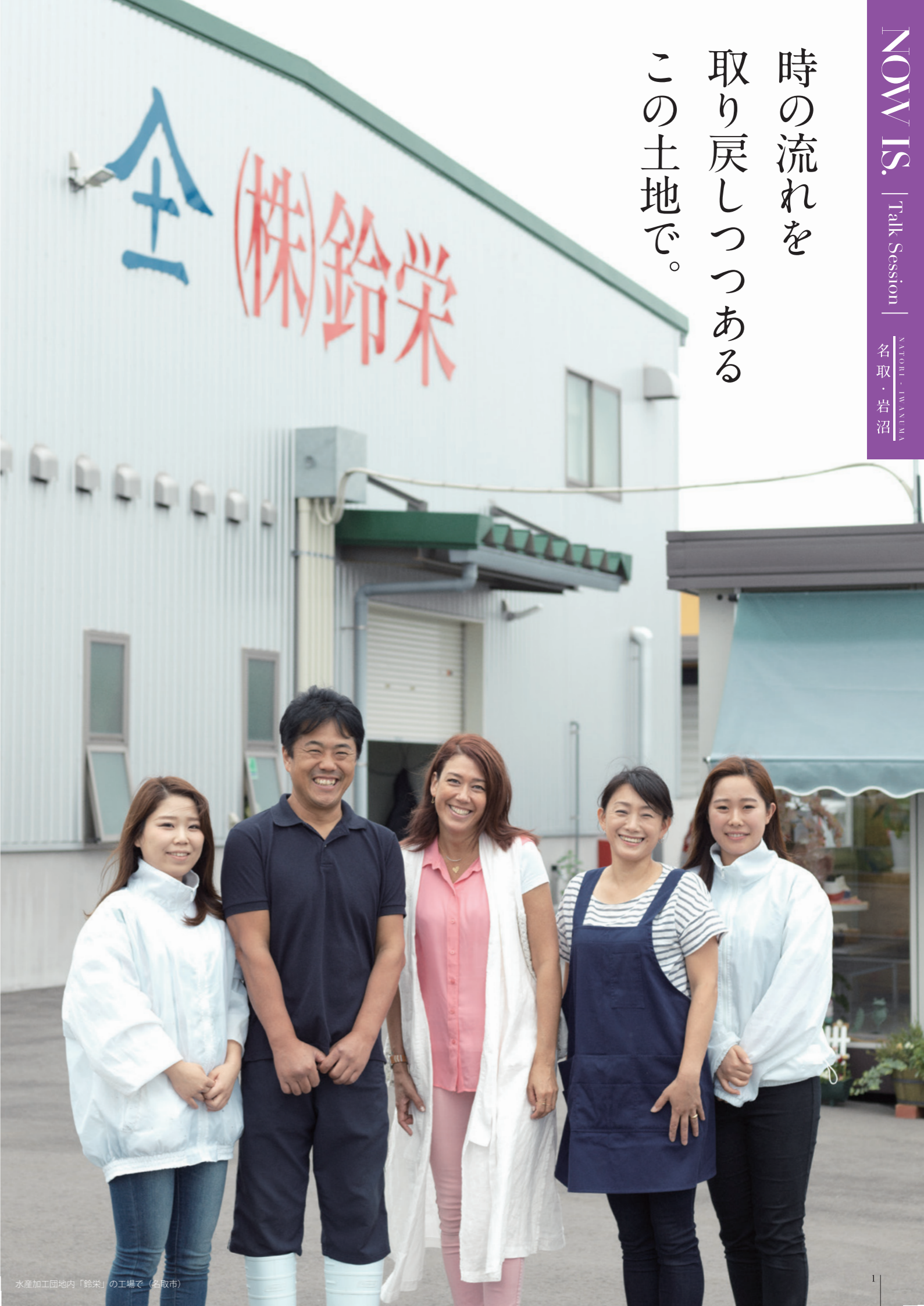
水産加工団地内「鈴栄」の工場（名取市）