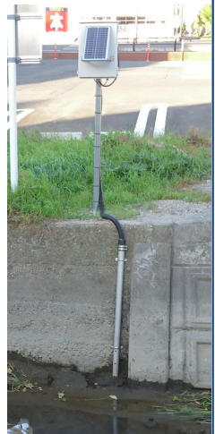
図・設置状況(大江川)