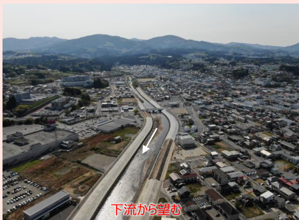
神山川（気仙沼市南郷地内） 河川堤防を整備中