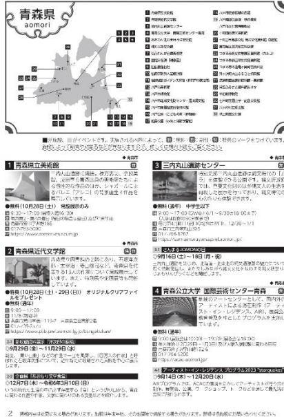
令和5年度ガイドブック

○東北6県と仙台市に配布する「東北文化の日」ガイドブックに、施設・イベント情報が掲載されます。