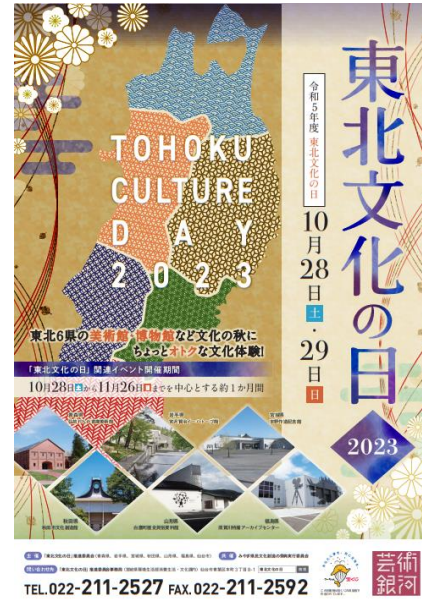
令和5年度ポスター