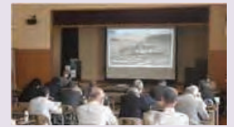
記念講演会の様子