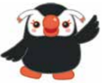
北方領土イメージキャラクター「エリカちゃん」