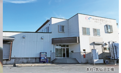
本社・気仙沼工場