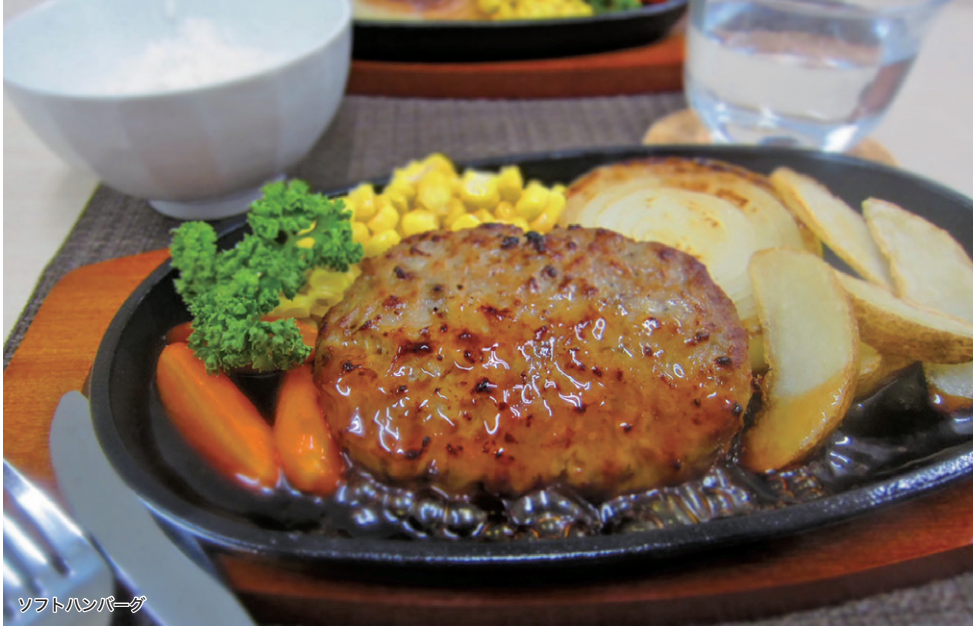
ソフトハンバーグ