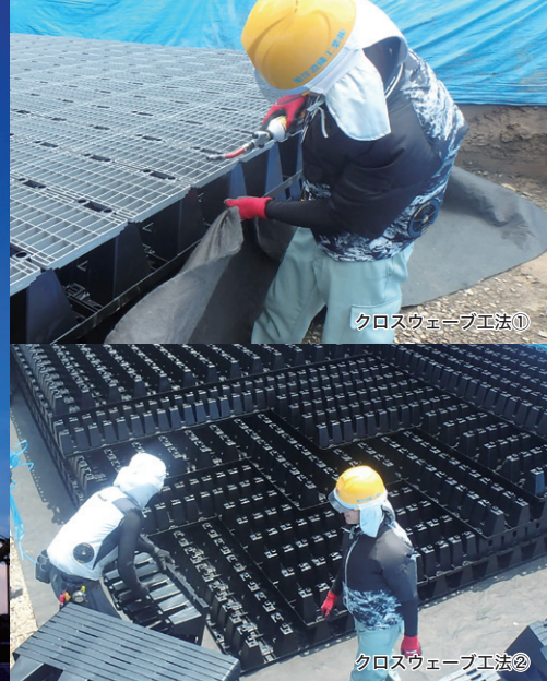
クロスウェーブ工法①