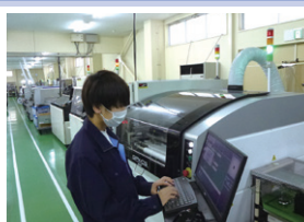
・各部署の体験をする。