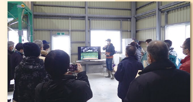
整備地区の担い手を対象とした視察研修

農地整備事業地区内での担い手への農地集積と経営の高度化を図るため、市町村や関係機関と連携し、土地利用調整や担い手の経営と技術の向上に資する研修活動等を支援しています。