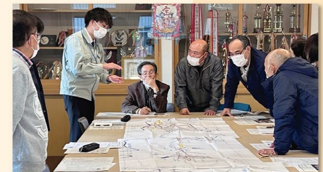
整備予定地区の計画説明

農地整備の実施を希望する地域の将来的な農業ビジョンや担い手への農地集積を含む営農計画の策定を支援し、整備予定地の現状を把握するための各種調査や整備内容の設計等、農地整備事業の計画作成に取り組みます。