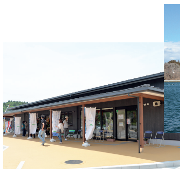
観光客で賑わう気仙沼大島ウェルカム・ターミナル