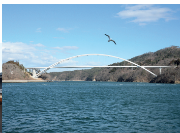
気仙沼大島と本土側を結ぶ 気仙沼大島大橋

「亀山」は、山頂の展望台からリアス海岸の大パノラマを一望できます。夜には、市街地の夜景やいさり火、満天の星空など雄大な景色を眺めながらゆったりとした時間を過ごすことができます。見どころ溢れる気仙沼にぜひお越しください。