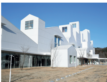
マルホンまきあーとテラス

ンしたマルホンまきあーとテラスは、各種イベントを開催しているほか、同施設内にある博物館では、石巻市の歴史や文化を学ぶことができます。また、外観・内観ともに写真映えるスポットとしても人気があります。