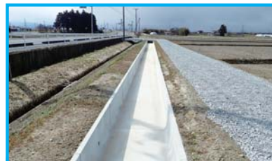
水利施設等保全高度化事業 (基幹水利施設整備型)大崎西部3期地区

ダム・頭首工・用排水機場・幹線用排水路等、基幹的な農業用排水施設の整備を行い、用水不足の解消や水害防止をはじめとした水利用の安定と合理化により、農業生産性の安定を図るものです。