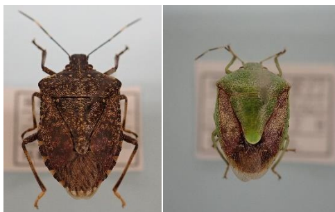
クサギカメムシ チャバネアオカメムシ 写真1 県内における主要果樹カメムシ類