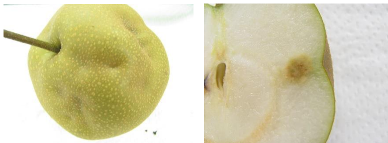
写真2 果樹カメムシ類によるなし被害果(左) 加害部の下は果肉はスポンジ状になる(右)