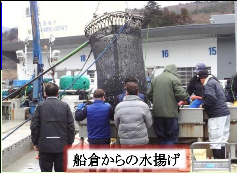
船倉からの水揚げ

マトウダイの名前の由来は魚体の中心にある斑紋(はんもん)が『的』のようであるという説や、顔が馬に似ている「馬頭(マトウ)」などがあります。冬が旬の魚でムニエル料理などが有名です。