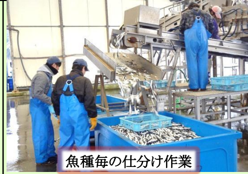
魚種毎の仕分け作業