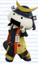
仙台・宮城観光PRキャラクター むすび丸