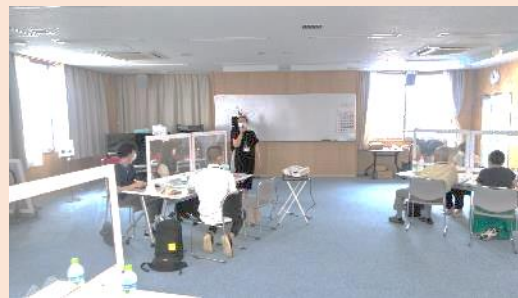
「閑上食堂」の実施報告