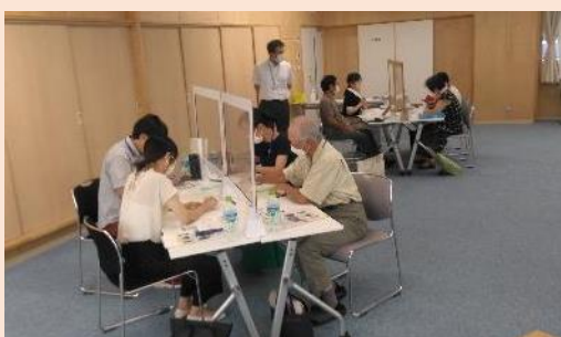
「ゆりあげディスカバー」実施に向けた話し合い