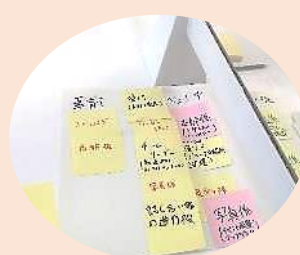
役割分担を考えて、付箋紙に書き出します。