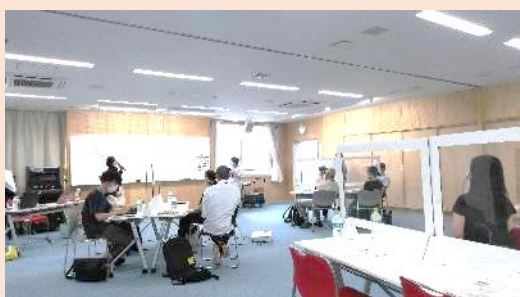
「ゆりあげホットステーション」の実施報告