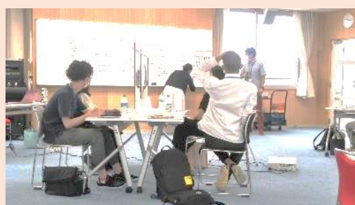
「お弁当プロジェクト」の実施報告