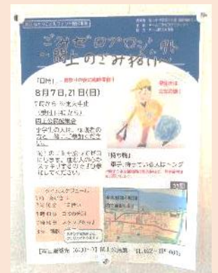
小学生が企画した「ゴミゼロプロジェクト」