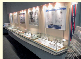
東日本大震災文庫展Ⅻの様子

〒981-3205 仙台市泉区紫山1-1-1 ☎ 022(377)8498 FAX 022(377)8492 午前9時～午後7時(日曜祝日は午後5時まで) 休館日/月曜(祝日の場合は翌日)