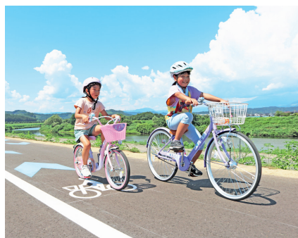
サイクリング・ウォーキングコース