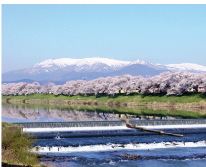
白石川堤一目千本桜 葦神壇からの景色

散歩などを楽しむ方が増えています。また、にぎわい交流施設やドッグランなどの新たなスポットも計画ですので、ぜひ遊びに来てください。