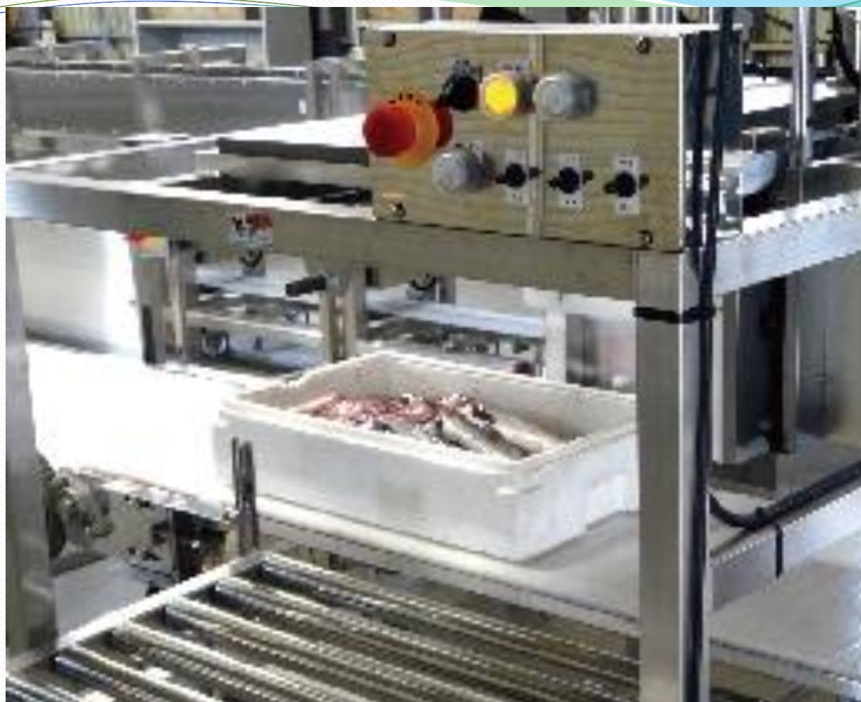
連続個別非破壊放射能測定システム(A02型) 横65ベクレル以上 前65ベクレル未満