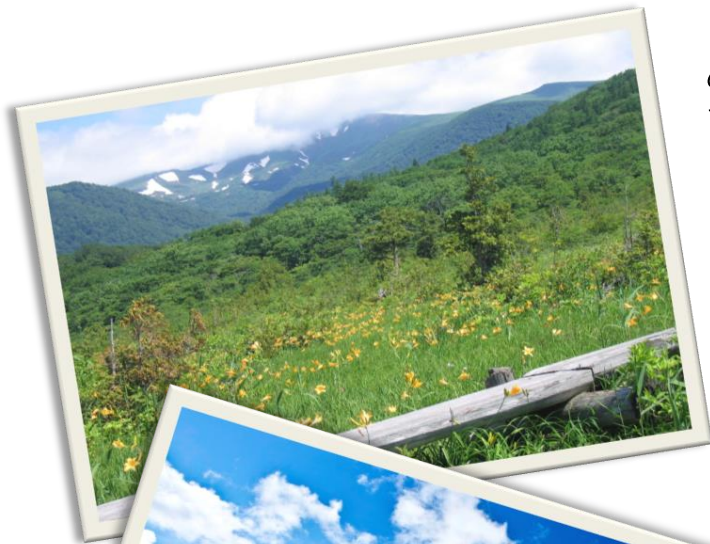
6月下旬 世界谷地原生花園