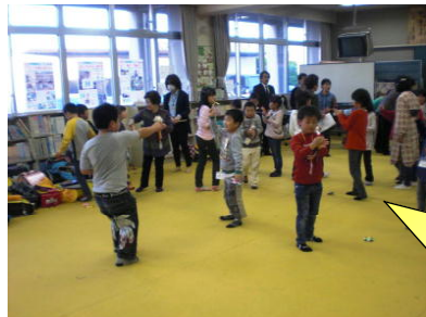
いただいた景品で すぐに遊び始めました