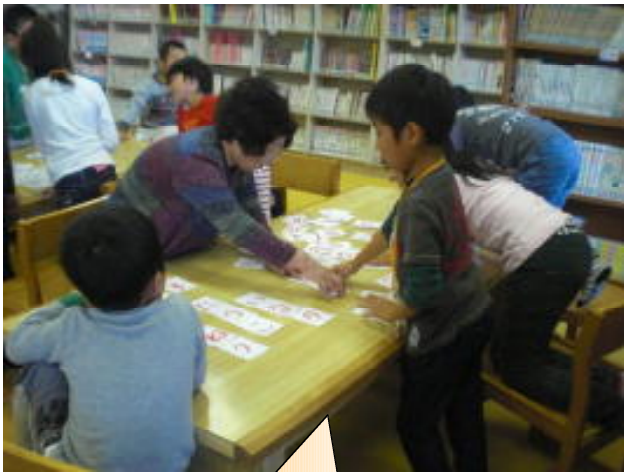
カードを組み合わせて ことばをつくるゲームです