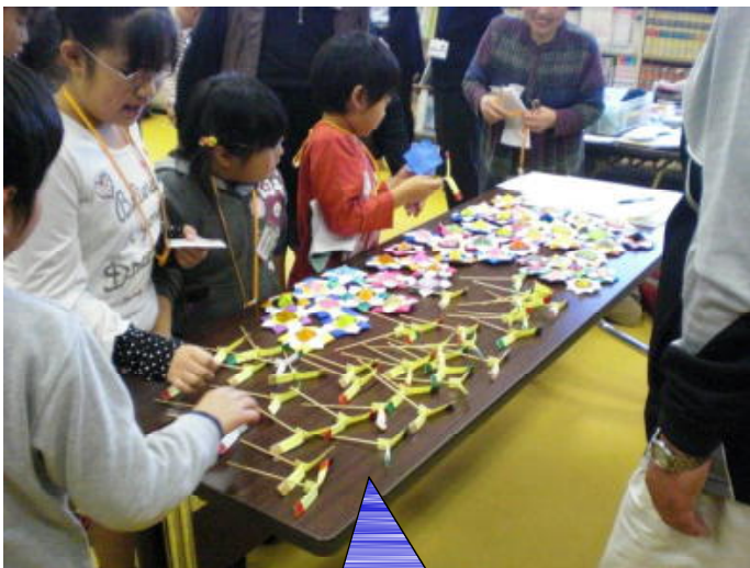
スタッフさん手作り 折り紙コマ&竹とんぼ