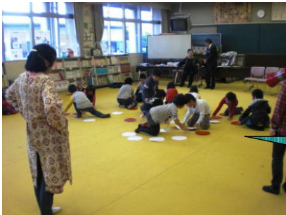
25個の防災グッズを 考えるのも一苦勞!