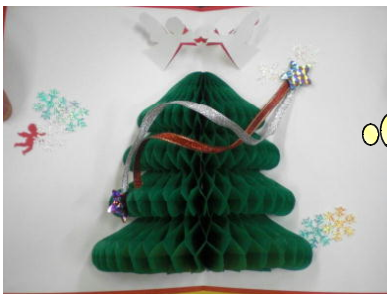
次回はクリスマス 飾りを工作します。 (スタッフさん作)