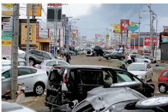
3月13日 多賀城市八幡前（自衛隊）