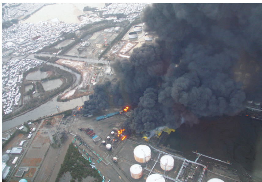
3月11日 黒煙を上げるJX日鉱日石仙台タンク