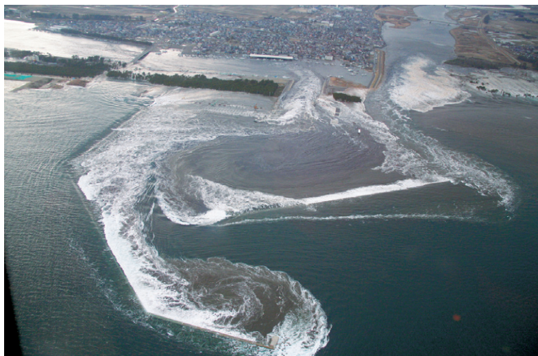
名取市関上漁港へ流入する津波