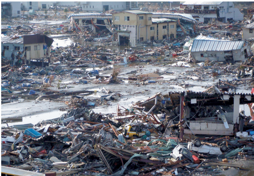
3月12日 気仙沼市朝日町