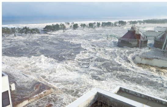
岩沼市下野郷 防潮林を越える津波