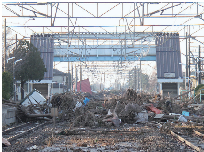
3月14日 がれきに覆われたJR浜吉田駅（巨理町）