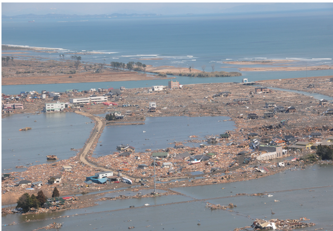
名取市關上（名取市）