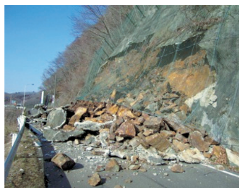
川崎町大字支倉地内 道路のり面の崩落（川崎町）