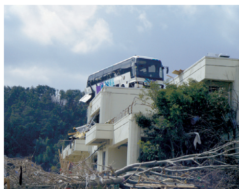
3月18日 津波により雄勝公民館の屋上に乗り上げたバス (石巻市)