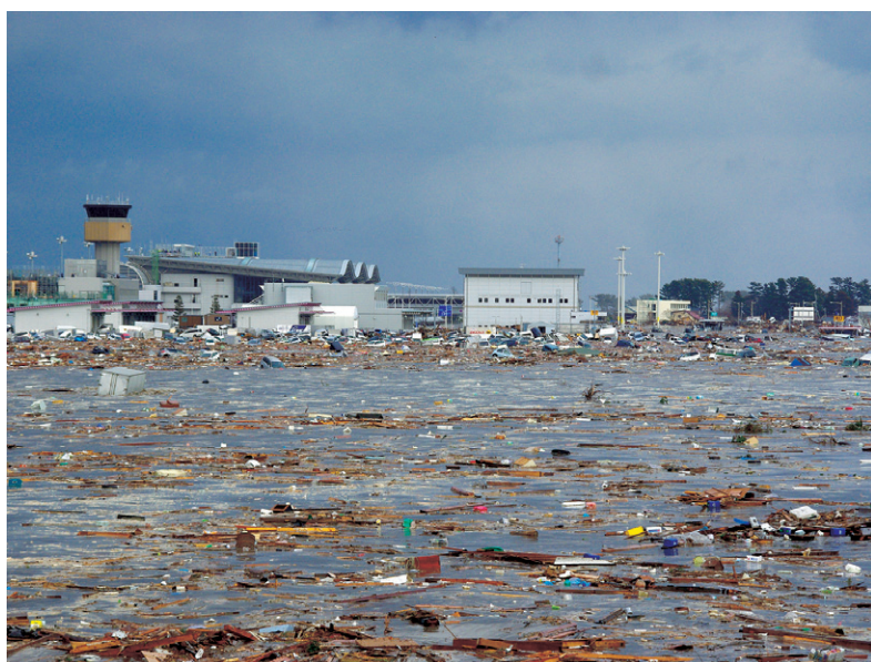
がれきに覆われた仙台空港 (第二管区海上保安本部)