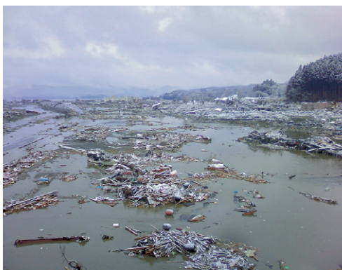
3月11日 津波襲来後の南三陸町