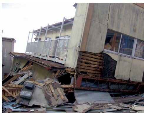
3月18日 登米市迫町 建物の倒壊