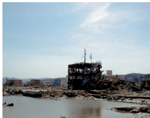
3月14日 南三陸町防災対策庁舎