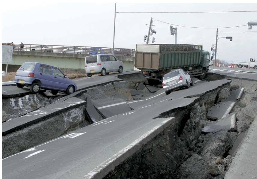
3月11日 大崎市古川江合橋付近 崩落する道路（大崎市）