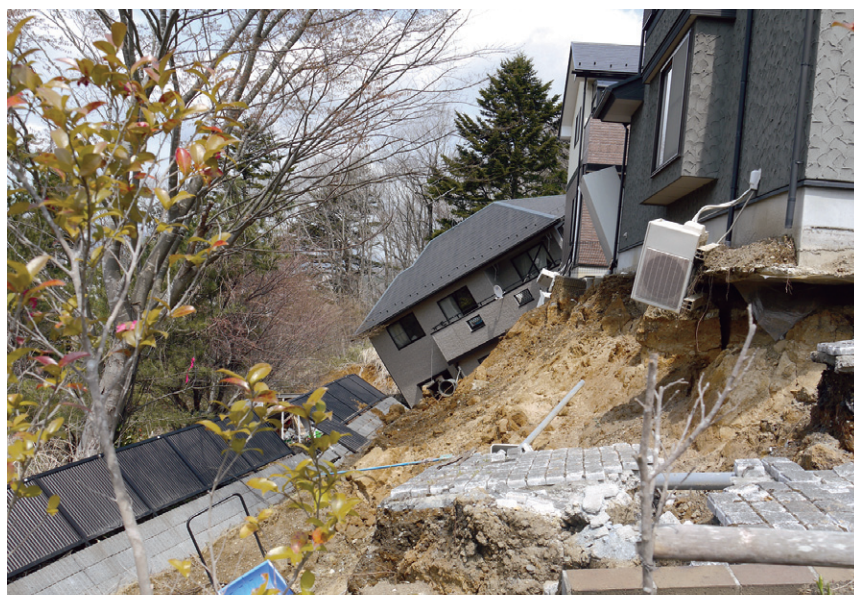
仙台市青葉区西花苑 丘陵部の宅地被害（仙台市）