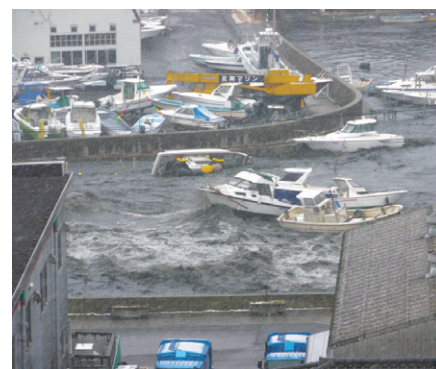
塩竈市 貞山運河に流入する津波