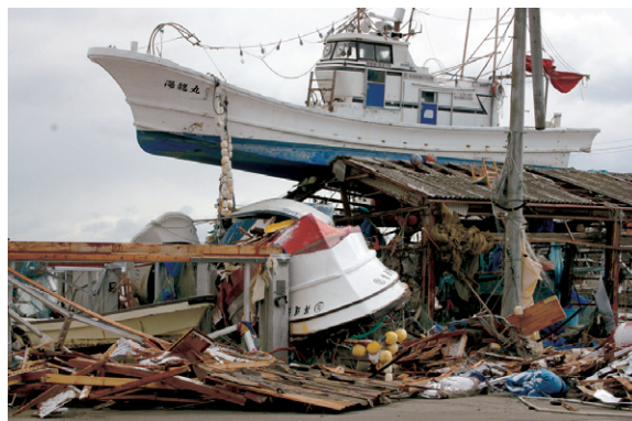
3月17日 津波により建物の上に乗上げた船（七ヶ浜町）