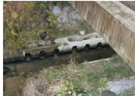
多孔コンクリート護岸