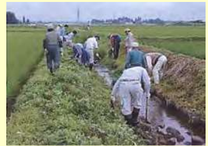
ドジョウ水路の管理

草刈り・泥上げ等（農業者 5 人、非農業者 5 人、水土里ネット 2 人、町 2 人、NP015 人） 見回り（水土里ネット のべ 180 人）