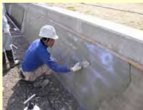
コーティング作業の状況