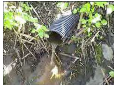
暗渠排水洗浄状況