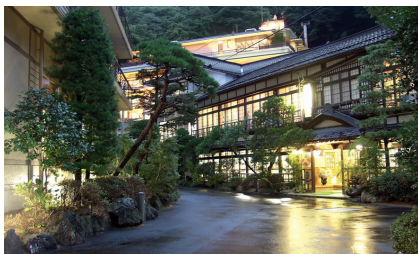
風情ある街並みの鎌先温泉

「鎌先温泉」は、鎌で源泉を掘り当てたことからその名が付き、傷を癒す薬湯として古くから親しまれています。「小原温泉」は、深い渓谷に面し、目に効くといういわれから「目に小原」と言い伝えられています。また、「白石湯沢温泉」は、1200年続く天然自噴の湯であり、数少ない含石膏芒硝泉の温泉です。