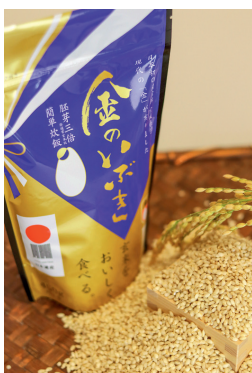
ブランド米「金のいぶき」

令和3年9月末現在 人口:15,298人 世帯数:5,989世帯 企画財政課企画班 ☎0229(43)2112