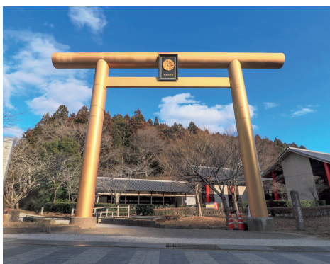
日本初の産金の事績を今に伝える黄金山産金遺跡

ぶきは、GABAやビタミンE、食物繊維などが豊富な上に、白米と同様の水加減で、つけおきいらずで炊飯できる高付加価値な玄米食専用米です。おいしくて健康的な涌谷町の「金のいぶき」を毎日の食卓に取り入れてみませんか？