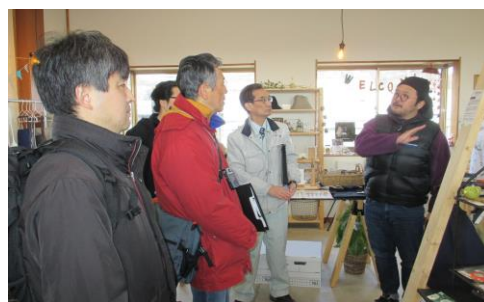
(新規開業店舗への訪問の様子)

活動紹介の後は、実際に新規開業店舗を訪問し、店主から開店に至った経緯などを聞いたり、くりこま商家のひな祭りを見学したり、商店街の活性化へ向けた取り組みを学ぶことができました。