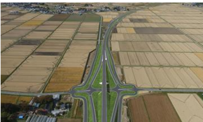
中田インターチェンジ完成予想図