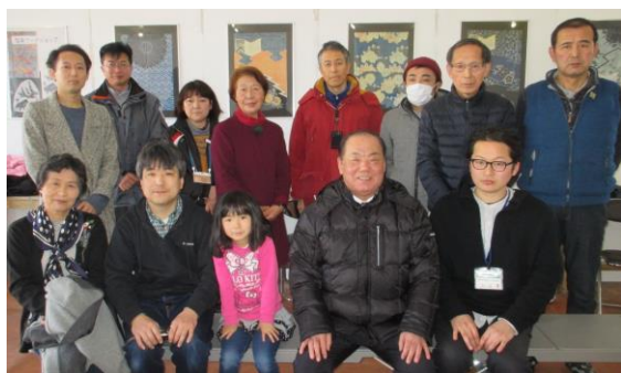
(見学会に参加した皆さん)

この素晴らしい活動を知り、それぞれの地区の活性化につなげようと、支部会員や地域づくり活動に興味のある方々など19名が見学会に参加しました。