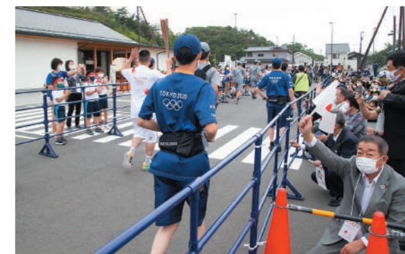
第1走者を見送る観覧者