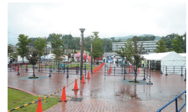
セレブレーション会場準備の様子