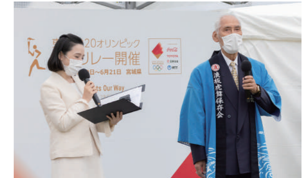
浪板虎舞保存会の出演者を紹介する司会者