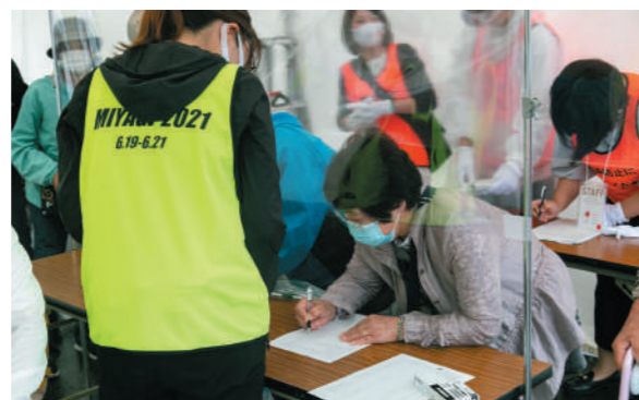
感染症対策のため、必要事項を記入する来場者