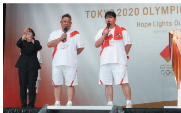
サンドウィッチマン 特別インタビューの様子