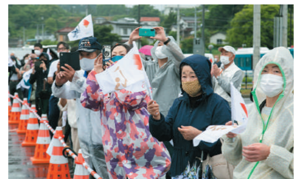
沿道から拍手を送る観覧者