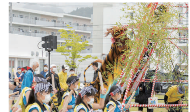
浪板虎舞保存会による演舞の様子