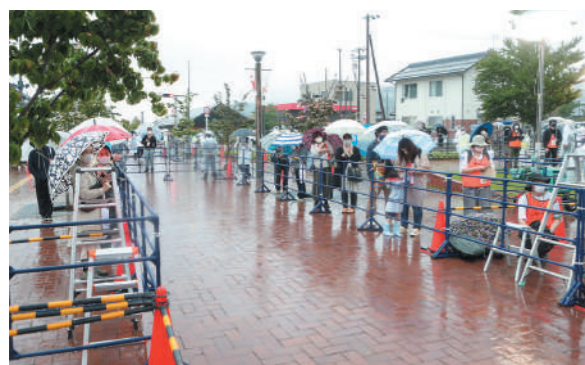
ランナーの到着を待つ観覧者