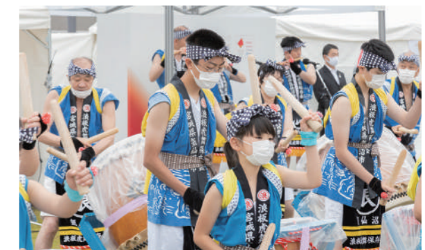
浪板虎舞保存会による演舞の様子