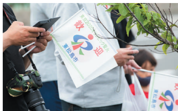
ランナーを歓迎するフラッグ