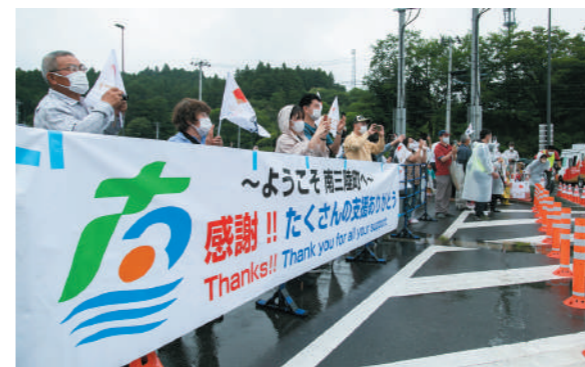
復興支援の感謝を伝える横断幕を掲げる観覧者