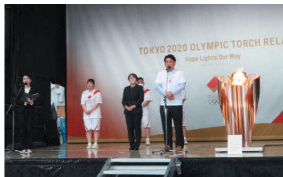
須田善明 女川町長による実行委員会代表挨拶