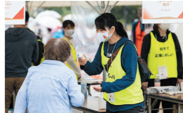
来場者の検温を行うスタッフ