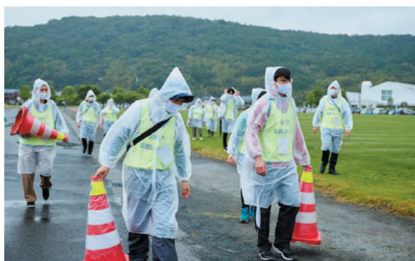
走行ルートの設営を行うスタッフ