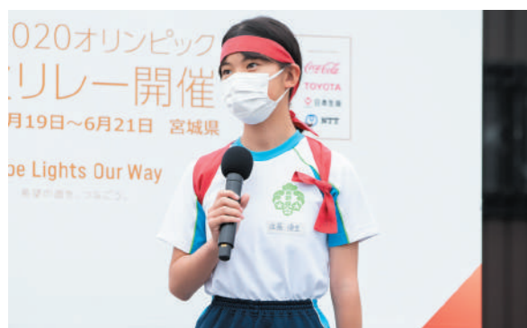
ふるさと宮野森太鼓 代表者へのインタビュー