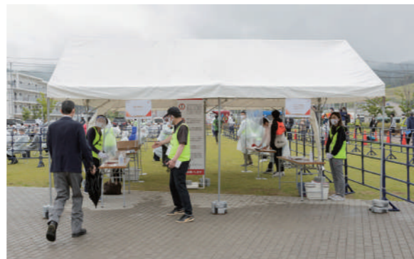
受付対応を行なうスタッフ