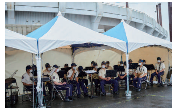
ウェルカムプログラムで演奏する石巻広域消防音楽隊