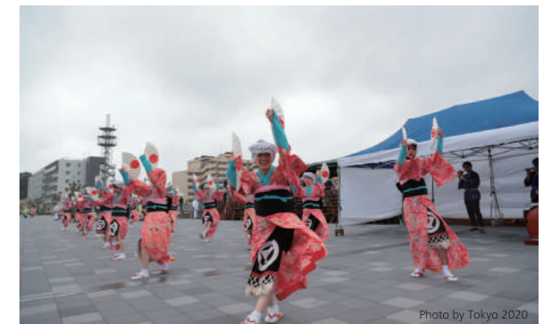
元気いちば前の堤防で聖火リレーを盛り上げるはねこ踊り