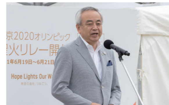
菅原茂 気仙沼市長による実行委員会代表挨拶