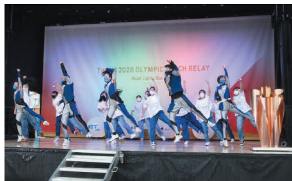
ダンスを披露する仙台城南高校ダンス部