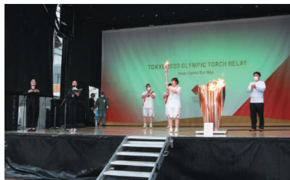
聖火皿へ点火された聖火