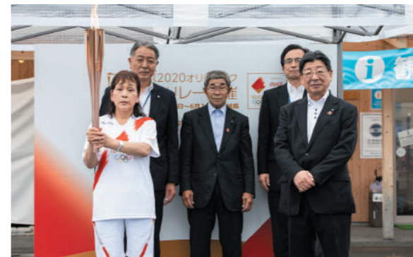
ランナーと実行委員会関係者によるフォトセッション