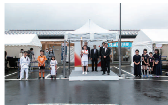
サポートランナーとして参加した町内のスポーツ少年団