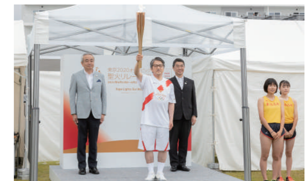
聖火リレー 出発式の様子