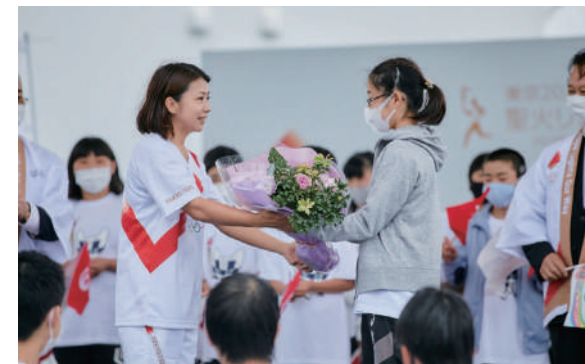
聖火ランナーへ記念花束を渡す市内代表小学生