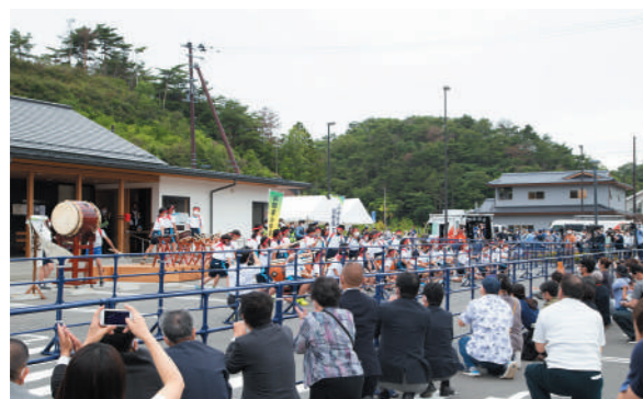
東名駅前（野蒜ヶ丘集会所前）の出発式の様子