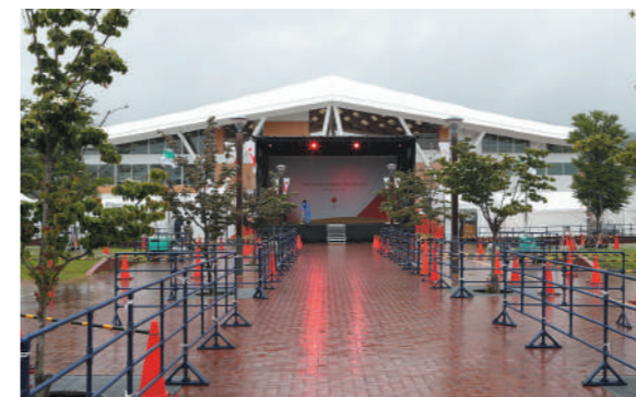
女川駅前に設置されたメインステージ