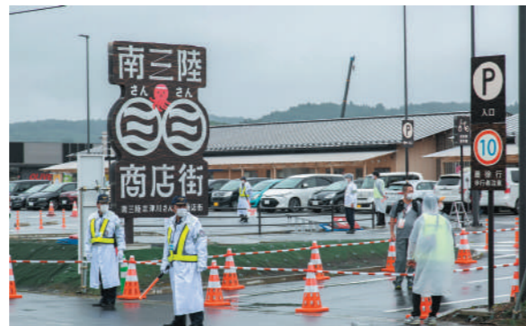
ミニセレブレーション会場となった南三陸さんさん商店街