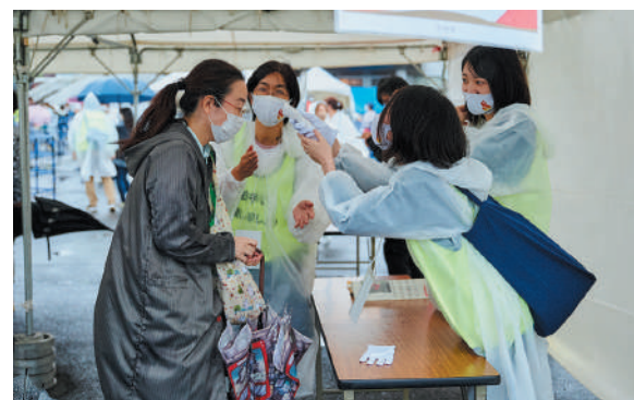
来場者の検温を行うスタッフ