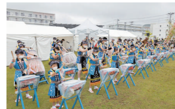
浪板虎舞保存会による演舞の様子