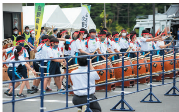
宮野森小学校児童によるふるさと宮野森太鼓演奏の様子