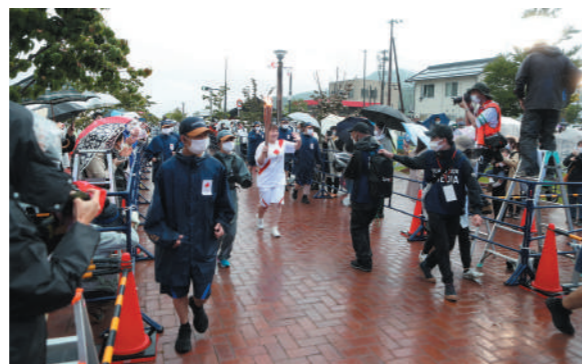
会場に到着した聖火ランナー