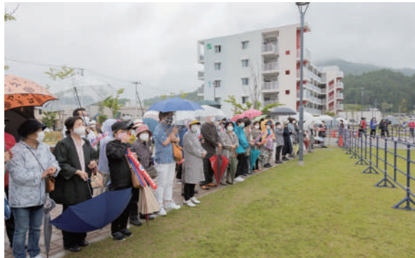
出発式に集まった観覧者