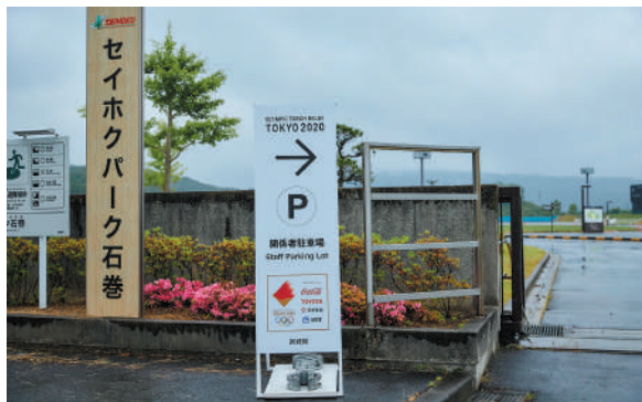
式典会場となったセイホクパーク石巻 (石巻市総合運動公園)