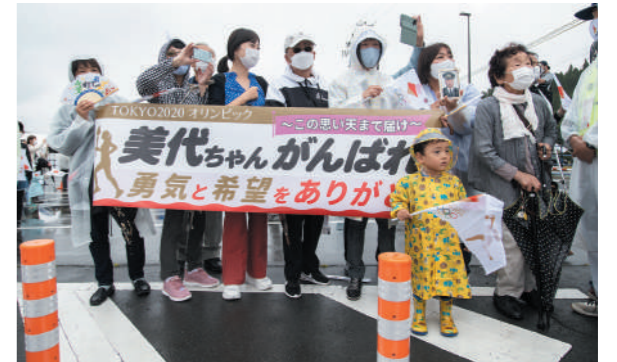
ランナーを激励する横断幕を掲げる観覧者