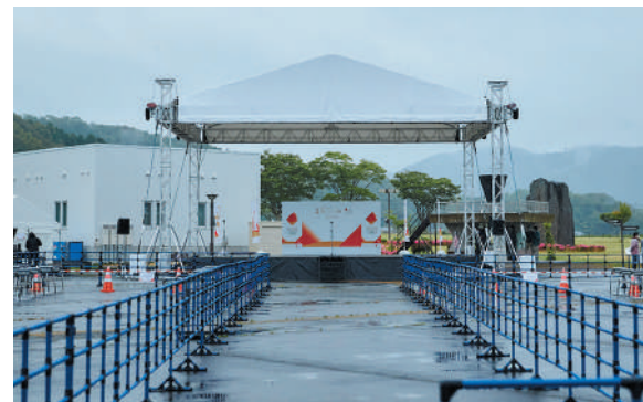
メインステージに向かう走行ルートの様子