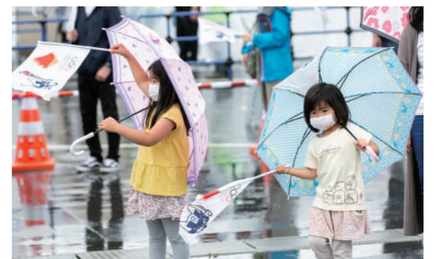
沿道からエールを送る子供たち