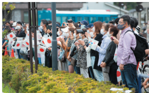
沿道から拍手を送る観覧者