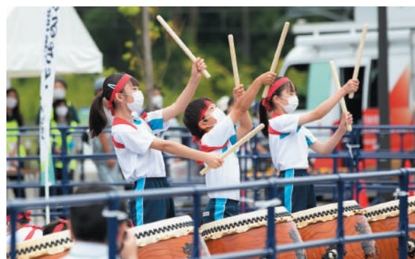
宮野森小学校児童によるふるさと宮野森太鼓演奏の様子