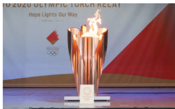
セレブレーション会場を照らす聖火