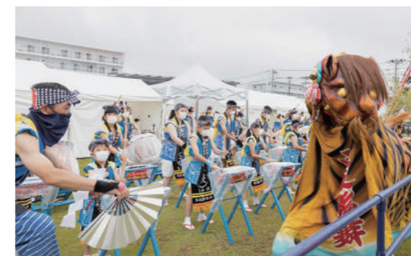
浪板虎舞保存会による演舞の様子