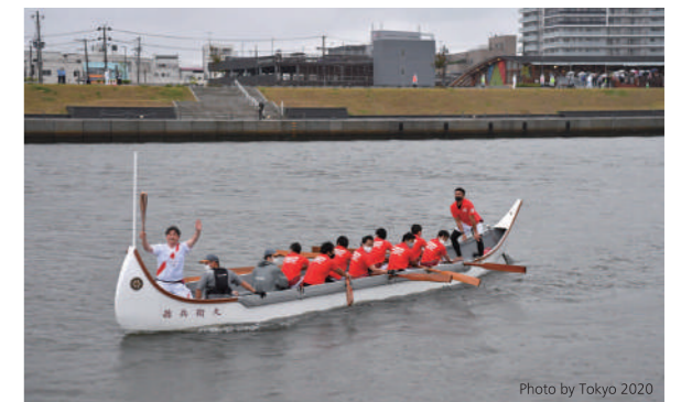
孫兵衛船による聖火リレー