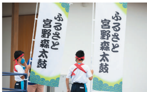
宮野森小学校児童によるふるさと宮野森太鼓演奏の様子