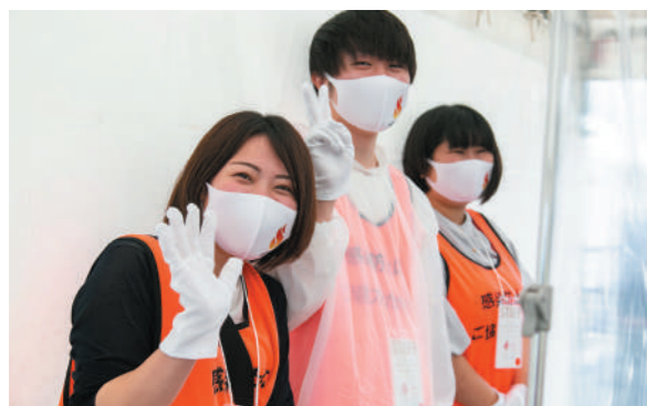
受付対応を行うスタッフ