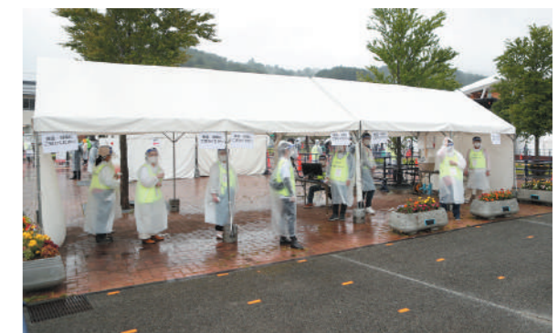
来場者を迎えるスタッフ