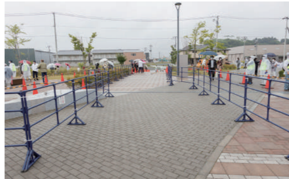
走行ルート設営の様子