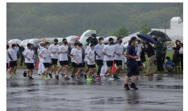
サポートランナーの様子