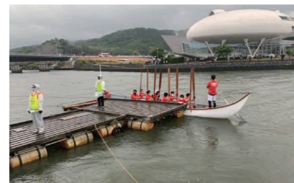
漕ぎ手は石巻広域消防本部職員