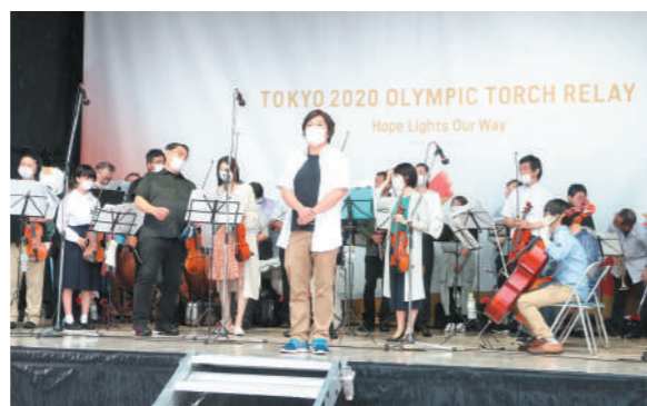
石巻市民交響楽団による演奏