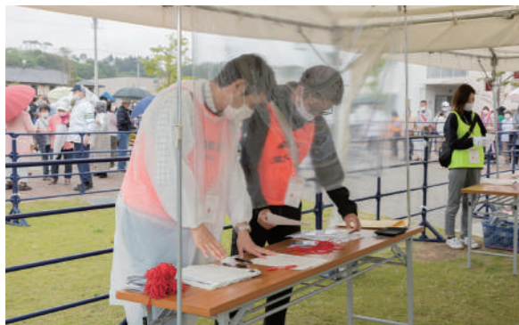
受付の準備を行なうスタッフ