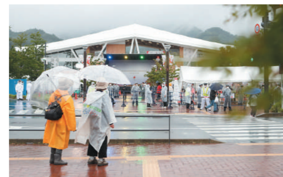
セレブレーション会場 運営の様子