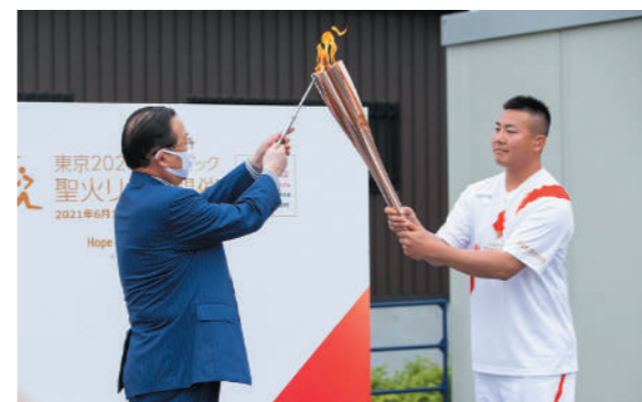
渥美市長から聖火ランナーのトーチに灯された聖火