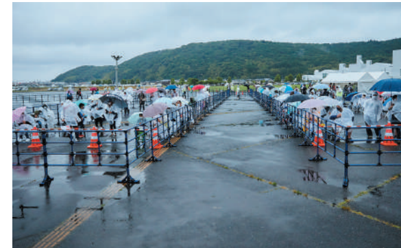
聖火ランナーを待つ観覧者