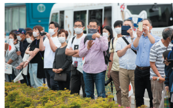
沿道から記念撮影をする観覧者