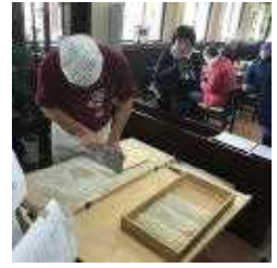
花山新そばまつり

台風19号で被災された方々にお見舞い申し上げます。 被災した皆さんへの支援情報は、県や市のHPで確認して下さい。