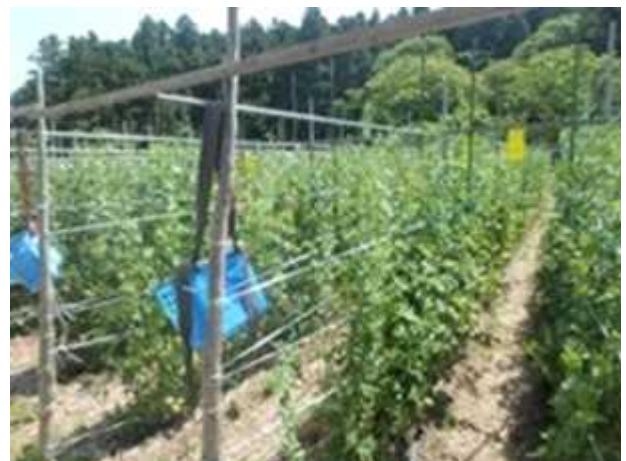
瀬峰地区で栽培予定の作物 (スナップエンドウ)

■お問い合わせ 農業農村整備部農地整備第1班 Tel:0228-22-2401 農地整備第3班 Tel:0228-22-2402