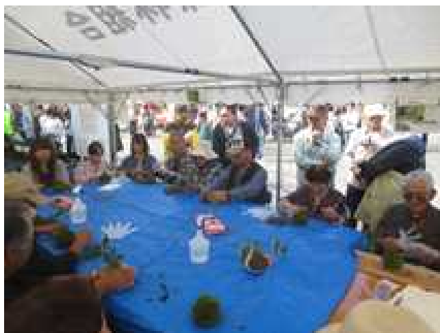
参加者で賑わう苔玉教室