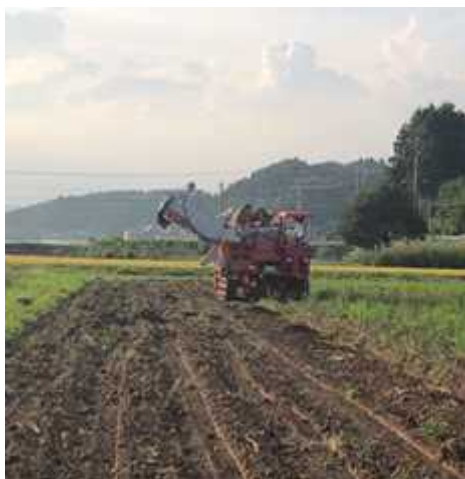
ばれいしょ収穫の様子