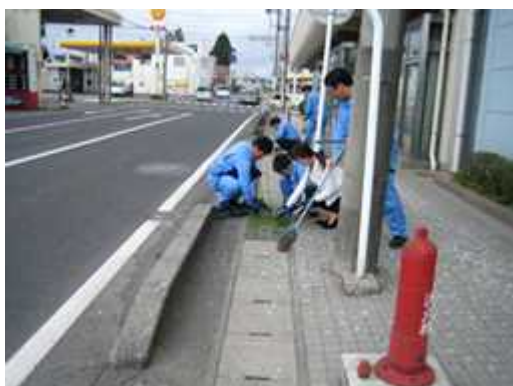
東北電力(株)栗原登米電力センター