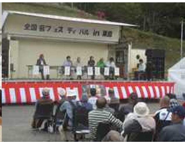
盛上がったパネルディスカッション