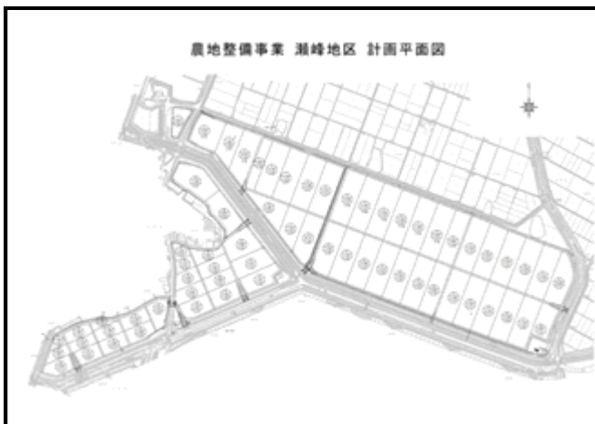
瀬峰地区計画平面図

そこで、瀬峰地区では、農地整備事業により前述の課題を解決し、水稲栽培における生産性の向上を目的とするほか、近年導入が進みつつある水稲直播等の新技術や地区周辺で栽培されているかぼちゃ、スナップエンドウ、そらまめといった高収益作物の導入により、田んぼの汎用化を通じた収益向上を目指しています。