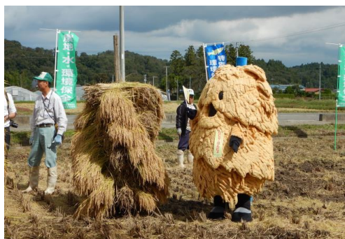
ねじり ほんによも来てくれました

なお、当日は説明の時間をいただき、当事務所から「農業と農村のいろいろなはたらき(多面的機能)」について紙芝居を用いてお話をしました。