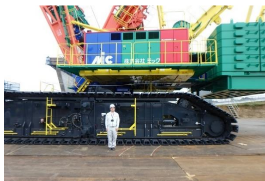
クレーンと人の比較