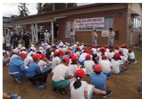
農業と農村のいろいろなはたらき

■お問い合わせ 農業農村整備部 管理調整班 Tel : 0228-22-2398