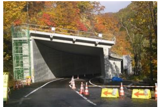
スノーシェッド施工状況(10月24日現在)

●(一)岩入一迫線(大崎市鳴子温泉鬼首字岩入～栗原市花山字草木沢 L=7.6km)