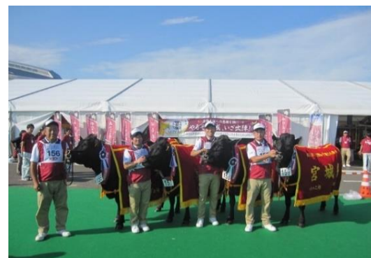
第5区 優等賞第4席の繁殖雌牛群の4頭