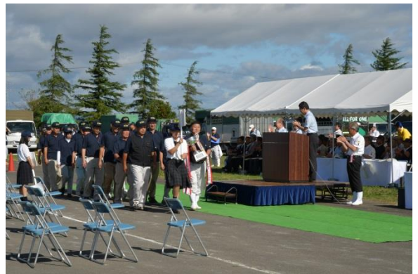
肉用牛の部 栗原地域の出品者の入場行進