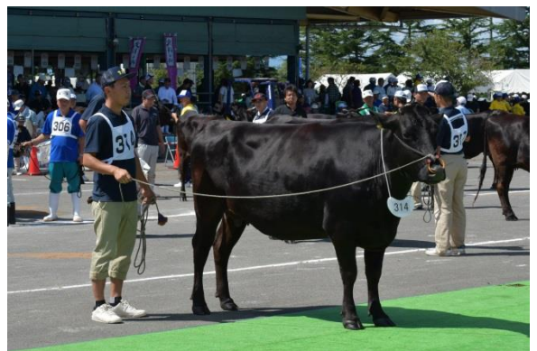
肉用牛の部 第3区最優秀賞