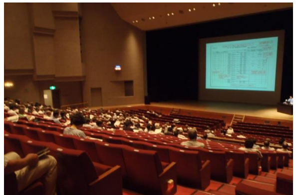
8月19日開催の活動支援研修会の様子