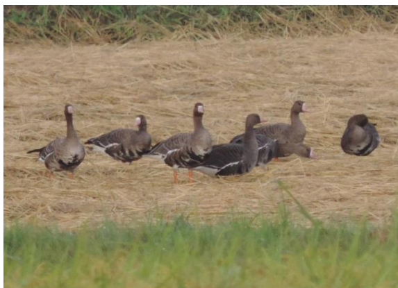
稲刈りが終わったばかりの水田で休む マガン

最盛期には 10 万羽を超える、ガン類の飛び立ちとねぐら入りは伊豆沼の冬の風物詩となっていますが、実はまだ、それほど寒くない今の時期でも 5 万羽ほどが飛来していることをご存じですか？最盛期の 1 月にはかないませんが、見応え十分です。さらに、今の時期は気候的に厳冬期よりも楽に観察ができ、日中は伊豆沼周辺の水田で餌を食べているマガンやハクチョウ類を見ることもできます。