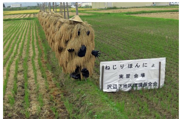
多面的機能支払組織による活動事例