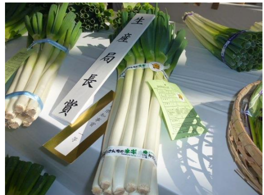
見事な出来映えのねぎ