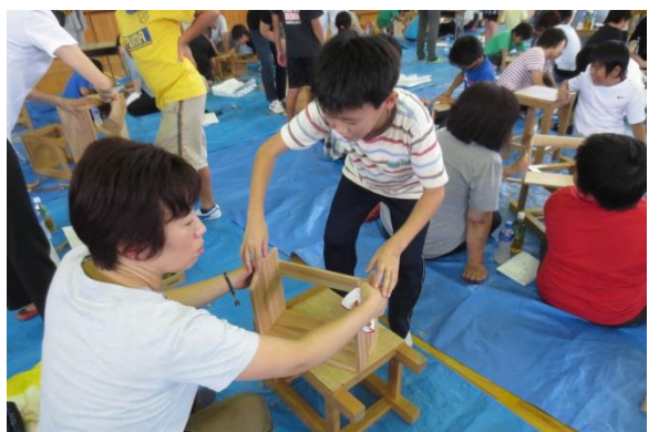
一迫小学校の親子木工教室の様子

当日は、第5学年児童の親子108名が参加し、栗原市内で植林されたスギを伐採・製材した、栗原産乾燥スギ板の本立てを製作しました。