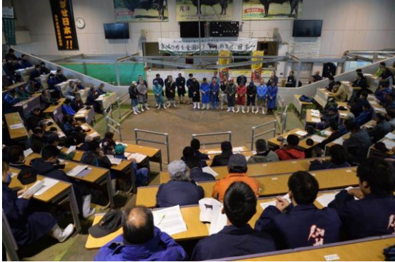
引き渡しの開会式の様子

70頭の雄子牛は、18戸の肥育農家に引き渡され、栗原管内には、2戸の肥育農家に8頭の出品候補牛が引き渡されました。これら70頭の雄子牛は、今後、17ヶ月の間、丹精を込めて育てられた後、平成29年9月の全共宮城大会肉牛の部で宮城県代表として8頭が選ばれ、大会で「日本一獲得」を目指します。