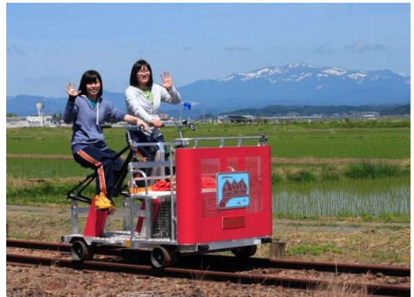
田園風景を走るレールバイク