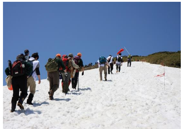
栗駒山の残雪を登る登山者

栗駒国定公園にある「栗駒山」は標高 1,626 メートルで、山頂からは月山、鳥海山、蔵王連峰、秋田駒ヶ岳、早池峰山、そして、太平洋が一望出来ます。山頂付近には 150 種におよぶ高山植物が群生し、山肌にはブナの原生林、湿原、渓谷、滝、湧き水など貴重な自然が手付かずのまま残され、野鳥や獣など数多くの生き物が生息しています。