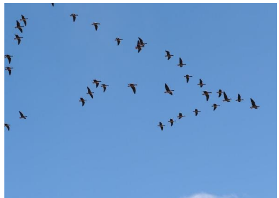
次のシーズンまでしばしのお別れです (北帰行中のマガンの群れ)

昨年9月19日、伊豆沼にマガンが14羽飛来して始まった冬の渡り鳥（冬鳥）シーズンですが、今年2月上旬から北帰行が始まり、心配されていた高病原性鳥インフルエンザの発生もなく、冬鳥のシーズンが終了しました。いつの間にか伊豆沼・内沼もすっかり静かになり、4月13日現在、マガンの群れは北海道の石狩平野まで移動しています。