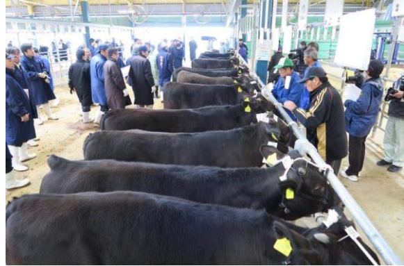
候補牛の審査風景