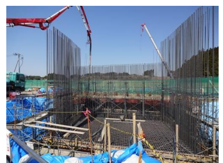
橋梁下部工の施工状況