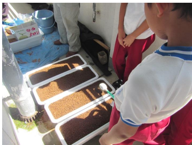
ハタケシメジの栽培にチャレンジ