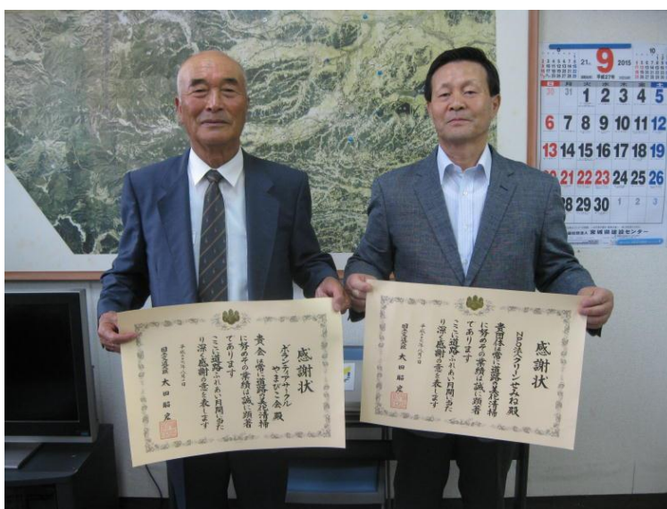
感謝状を手にする両団体代表者

両団体は県道の除草・清掃・緑化等の作業をボランティアで行うスマイルロードサポーターとしても活動しています。地域の「顔」とも言える県道の美化には、地域の方々自らの活動が欠かせません。当事務所からも様々な支援をさせていただきますので、今後とも御協力をよろしくお願いいたします。