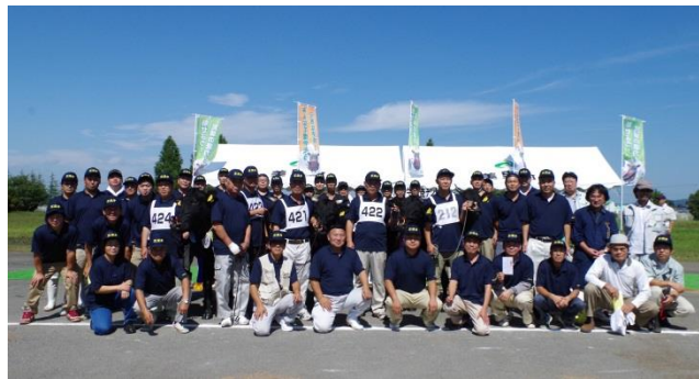
肉用牛部門で団体賞を受賞した栗原地区の皆さん