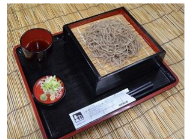
打ちたての新そば