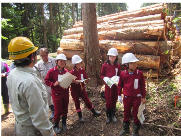
間伐作業の現場を見学

今後は、石巻市にある合板工場を見学し、身近にあるスギが木材として産出された後、どこで、どのように加工・利用されるのかを学習する予定です。