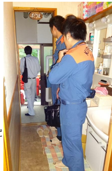
栗原市消防署と合同で実施した 防災査察の様子

県では、防災指導のほか、危険コンクリートブロック塀の改善指導などを実施し、火災、地震などによる建築物の被害を防止し、安全な空間・まちづくりの推進に努めています。