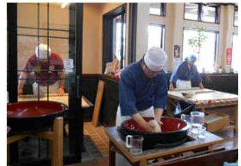
職人によるそば打ち風景

※そば打ち教室・コンニャクづくり教室のお申し込みとお問い合わせは、花山ふるさと交流館（0228-43-5111）