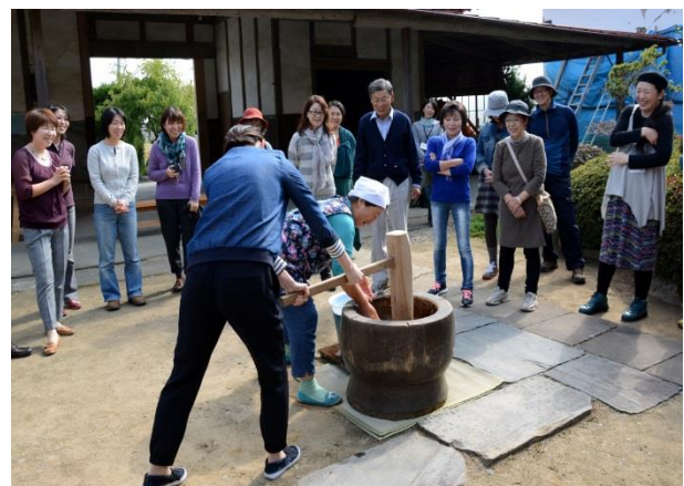
団体が行うプログラムの一つ 餅つき体験の様子