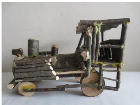
教育長賞（小学年の部）