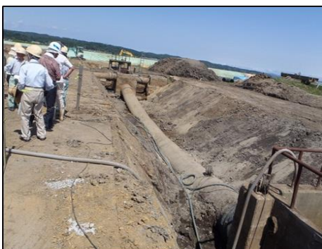
見学会 (旧施設のφ1200mmのたわみを確認)

供用開始後の9月11日に関東・東北地方を襲った豪雨においては、本施設から上流側での排水路溢れは確認されず、改修の効力が発揮されました。