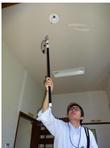
非常用照明が点灯するかを確認