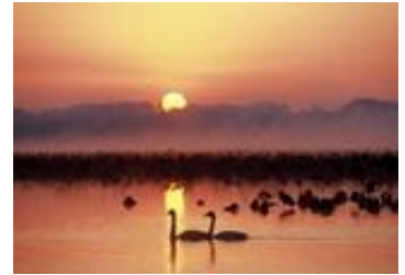
伊豆沼に飛来した渡り鳥