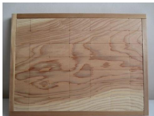
県知事賞（高学年の部）

なお、入選作品は、11月10日～14日に東北電力グリーンプラザ（仙台市青葉区・電力ビル1階）で展示されるほか、県知事賞の作品は、平成28年2月に行われる全国コンクールに出展されます。