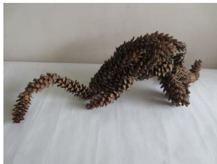
教育長賞（中学年の部）