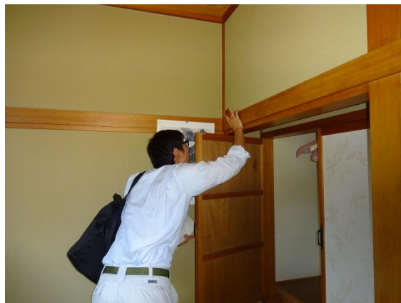
部屋の壁の仕上げを確認