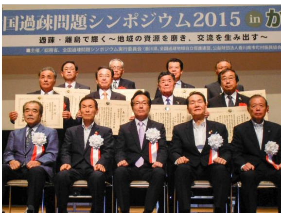
拍手に包まれる表彰式の会場 (小野寺会長：二列目左端)