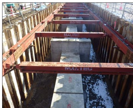
新しい施設 (ボックス高さ1200mm、幅1200mm)