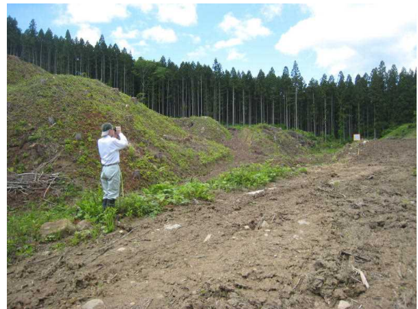
【植栽対象地を測量】

区域は、雑草の繁茂前でありましたが、今後、梅雨時期前の植栽に向けて、植え付け方法等について指導する予定です。