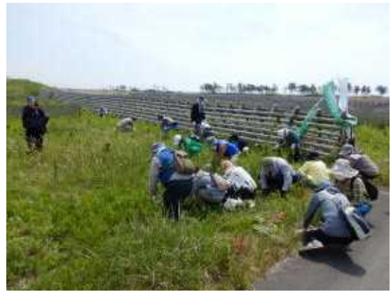
【海岸林保育体験の様子】

地域の皆さんには、こうした企画への参加により、身近な海辺の風景や鳥の鳴き声が徐々に戻りつつあることを実感してもらおうなどして、将来的にも海岸林を見守り、育てていただくようお願いしたところです。