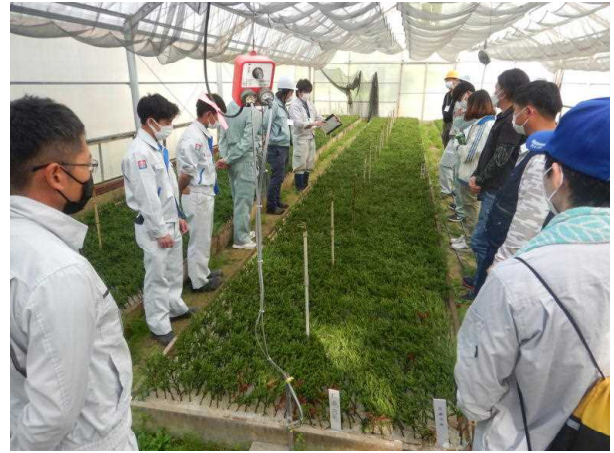
【少花粉スギ挿し木培養の説明】