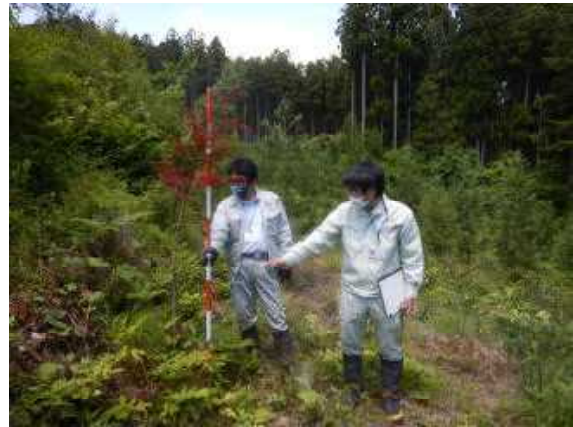
【造林地におけるニホンジカの食害調査】

また、登米市には、ニホンジカ被害を踏まえた森づくりの方向性について理解してもらうことができました。