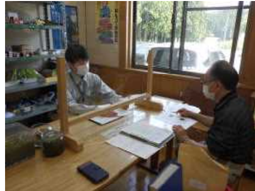
【間伐基礎知識の講義】

受講生は森林組合職員であり、将来的には森林の買い取り業務も担うこととなるため、理解度も高く有益な研修となりました。