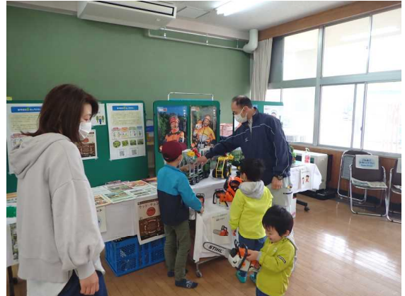
【林業PRコーナーの玩具で遊ぶ子供の様子】

今後も、関係機関と連携し、林業をPRする機会をつくり、一般県民が林業へ興味を持っていただけるような普及活動を行っていきます。