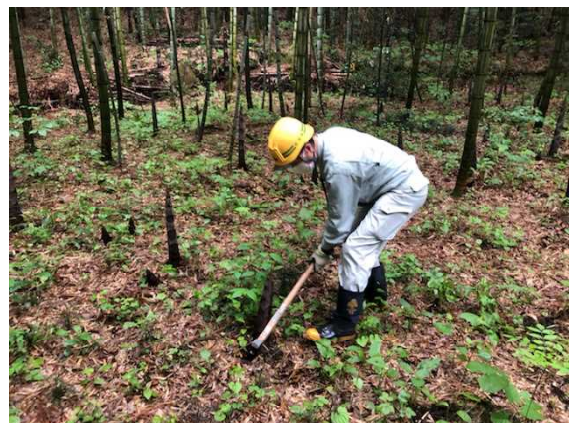
【たけのこ検体採取の様子】

今後、検体の放射能濃度結果を踏まえ、出荷制限の全面解除に向け、生産者に対し各種情報提供を行うなど、丸森町と連携して支援していきます。