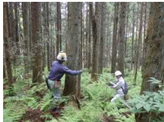
【異なる現場条件の積算上の課題について確認】

なお、森林所有者・地形・林令・林況・伐採率等が異なる事業箇所をどのような単位で委託に付すかや設計において林小班単位に積算するか、標準単価を採用するか等が課題と