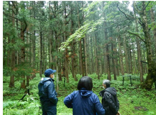
【間伐の現地検討の様子】