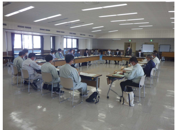
【仙南地域素材生産・流通推進会議の様子】

今後も、安定的で円滑な地域材の需給体制の整備が図られるよう、巡回指導等により各事業者の取組みを支援していきます。