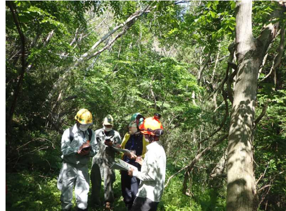
【現地調査での助言の様子】