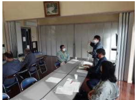
【地元説明会の状況】

①まず、地元への説明として、東松島市担当と連携し、「特別名勝松島」の区域でもある同市宮戸地区の行政区長等へ防除事業(空中散布)の内容を説明し、取り組みへの理解と協力をお願いしました(他の実施地区は行政広報で説明)。②続いて、防除業務の打合せとして、市町と委託先業者を対象に、当日の業務分担や時間スケジュール等を打合せ、安全かつ円滑な実施に向けて調整を図ることができました。