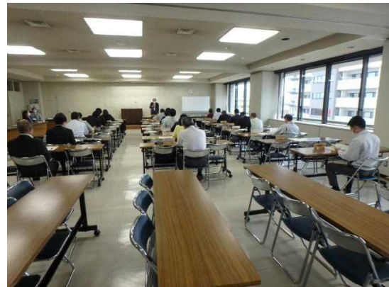
【市町村、林業事業者、森林所有者が一堂に会しました】