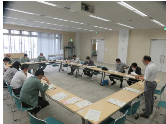
【管内担当者との打合せ状況】

このほか、保安林業務や環境保全業務、治山・林道業務についても当部各班から説明し、適切な森林整備に向けた意見交換を行ったところ理解が得られ、各業務の円滑な推進につなげることができました。