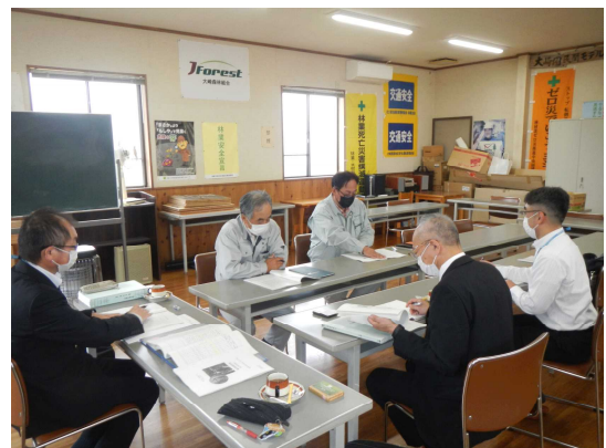
【事前打合せの様子】