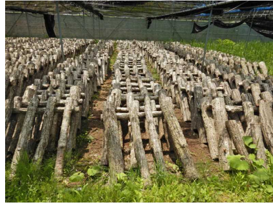
【もみ殻を敷いて直接地面と接することなく管理されているしいたけホダ木】

今回訪れた生産者は、秋のきのこ発生までに出荷制限一部解除を目指しています。秋に発生する原木しいたけを楽しみにお待ちください。