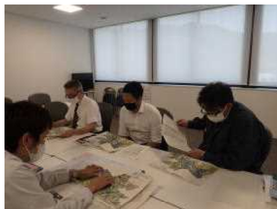
【林道開設について意見交換】

林道開設では、現地状況や想定される障害、推進スケジュールの調整などについて意見交換を行いました。今後、町としても震災復興から産業振興へ施策をシフトしていくなかで、町有林の収穫事業などを推進するなど、新しい林道開設を核とした林業振興を重点的に推進していく契機となりました。