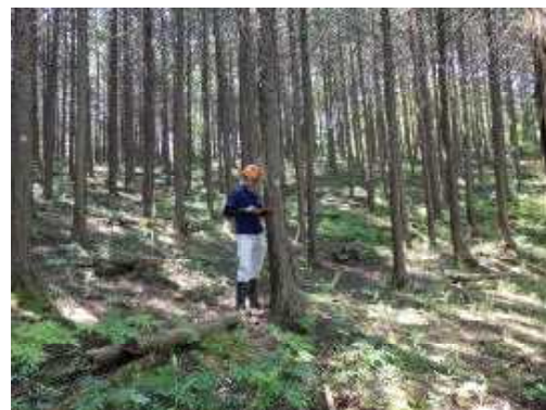
【ヒノキ林内のプロットを全木調査】