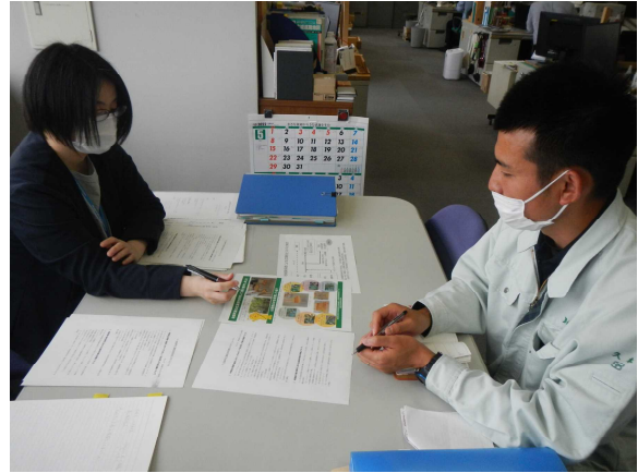
【広葉樹用材生産の取組みについて県森連と情報交換】

その結果、小ロットで生産された用材の有効活用について、きめ細かな販売支援を行うこととしました。