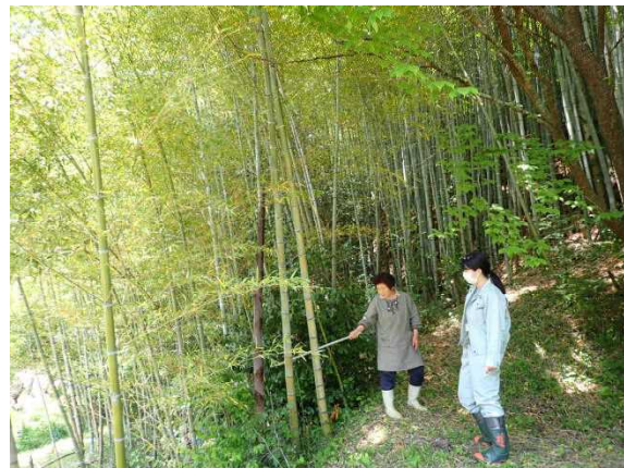
【メンマ増産に向けた竹林調査】

今後は、竹林整備の支援を行うとともに、伐採除去後の竹の利活用も含め検討を進め、竹林整備区域の拡大及びメンマ生産の普及拡大に向け取り組みを進めていきます。