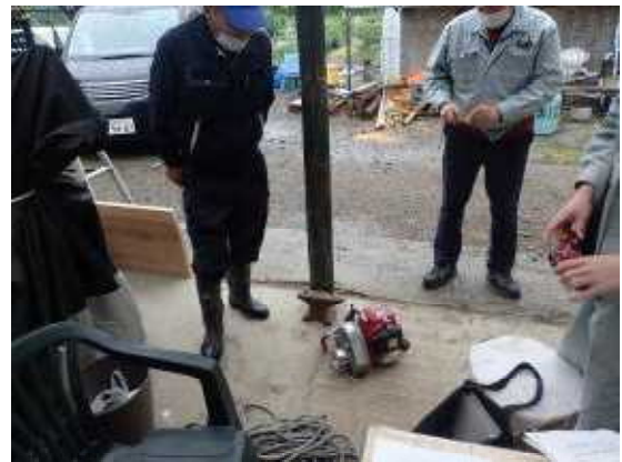
【間伐事業について意見交換】

今年度は要望額を下回る補助額配分であったため、事業計画（面積等）が実施可能かなどを打合せました。その結果、不足する事業費は搬出する間伐材の販売収入で補うことが可能なため、当初の計画どおりの規模で事業を進めていく予定となりました。