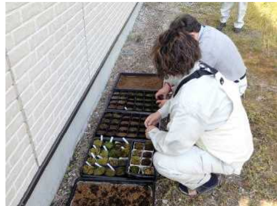
【現地での指導状況】