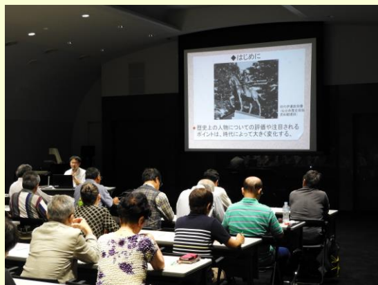
【みやぎ県民大学開放講座】

題名 「近代における伊達政宗」 日時 平成29年9月9日 場所 宮城県図書館 ホール養賢堂 対象 講座受講者 72人