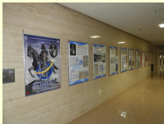
【移動展（県庁2階ロビー）】