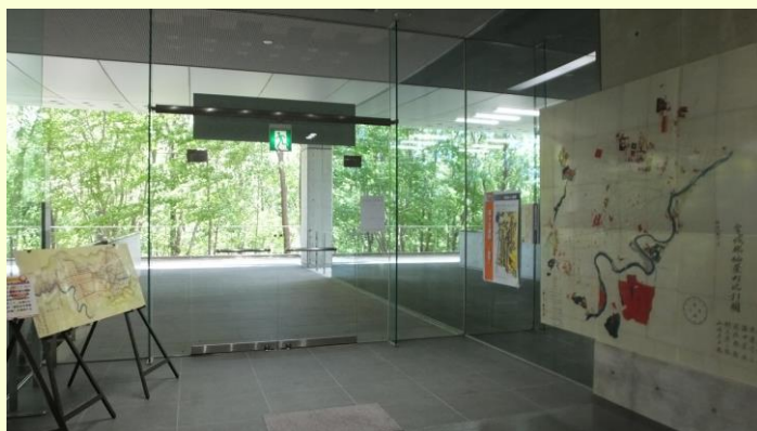
【常設展（公文書館入口）】