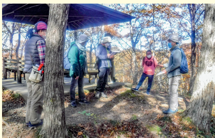
山の成り立ち教室の様子