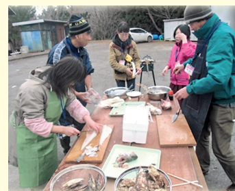
燻製づくりに挑戦!

南三陸町志津川湾の自然の恵みを味わいませんか?カキやホヤの燻製作り、魚介類のさばき方などの体験を通して、豊かな自然と冬の味覚を満喫していただけます。