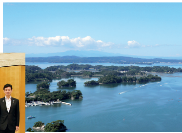
大高森からの景色

ました。聖火到着を記念して「スポーツ健康都市」を宣言し、震災後に整備された大曲浜地区の矢本海浜緑地公園パークゴルフ場や野蒜地区の奥松島運動公園、宮戸地区の宮城オルレ奥松島コースなどが新たな運動拠点として賑わいを見せています。