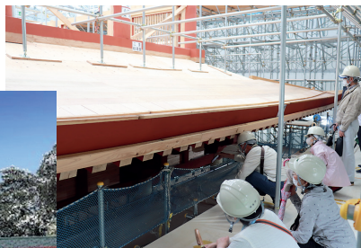
多賀城南門復元建設現場見学会の様子

に向けて、多賀城南門の復元に着手し、記録映像の制作も進めているところです。今年6月および7月には、復元途中の今だからこそ「分かる」「見える」、多賀城南門復元建設現場見学会を開催し、多くの人に足を運んでいただきました。