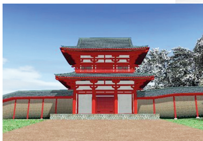
多賀城南門復元イメージ