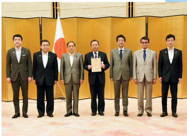
SDGs未来都市選定証授与式