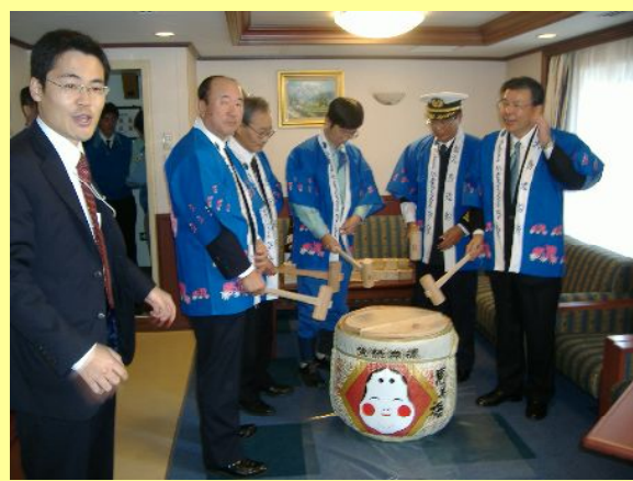
船上祝賀会の様子

荷物を全て降ろしたエスプリットロータス号は、5月29日に次の積み地に向けて無事出港していききました。