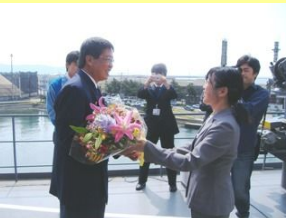
歓迎セレモニーの様子

「エスプリットロータス号」は総トン数43,621トン、重量トン数54,247トン（注）の大型船で、石巻港に今まで入った船の中でも1・2を争う大きさです。今回はチップ約45,000トンを積んで、オーストラリアからやって来ました。