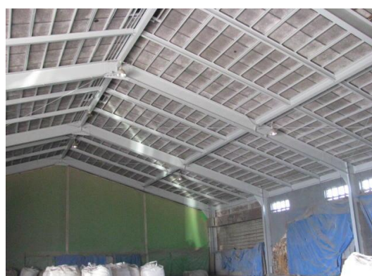
大手2号上屋施工後

工事期間中は、施設利用者及び関係者の方々にご協力いただきありがとうございました。大手2号上屋については次年度以降も内部塗装工事を予定しておりますので、ご理解・ご協力をよろしくお願いいたします。