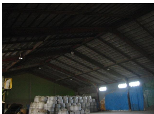
大手2号上屋施工前