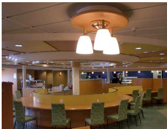
●日和ふ頭に停泊しているテクノスーパーライナー