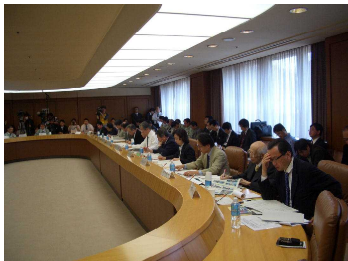
●宮城県震災復興会議の初会議

詳しい内容は、県庁ホームページでお知らせしています。HPのアドレスはこちら → http://www.pref.miyagi.jp/seisaku/