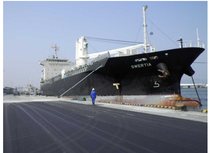
●中島ふ頭に入港した貨物船