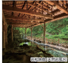
岩松旅館(天然岩風呂)