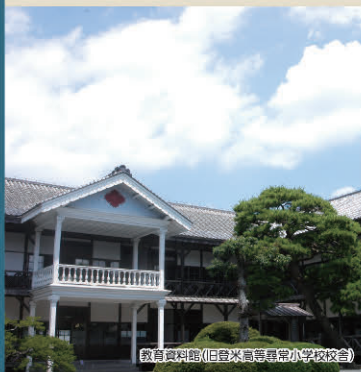
教育資料館(旧登米高等専修小学校校舎)