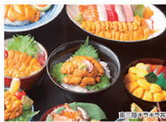
南三陸キラキラ食