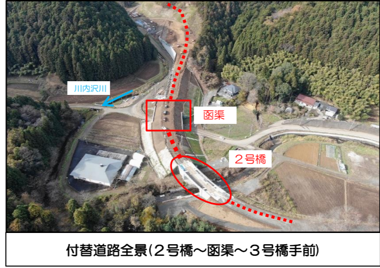
付替道路全景(2号橋~函渠~3号橋手前)