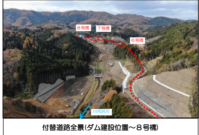
付替道路全景(ダム建設位置~8号橋)