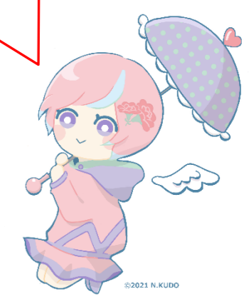
川内沢ダムイメージキャラクター「川内あい」

(R3補)農道2号橋上部工工事 ライブディック(株) R4.3.25~R5.3.31 【進捗率5%】 ⑩