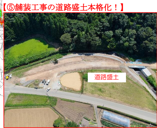
【⑤舗装工事の道路盛土本格化！】

(R3)6号橋下部工工事 (株)深松組 R3.6.30~R4.9.30 【進捗率 98%】 ①