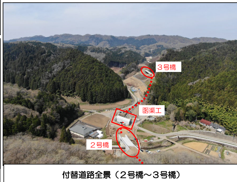
付替道路全景(2号橋~3号橋)