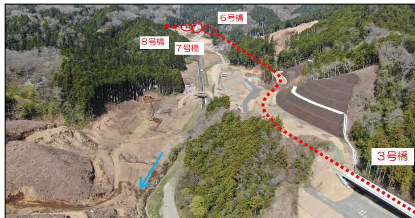
付替道路全景(ダム建設位置~8号橋)