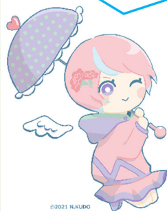
川内沢ダムイメージキャラクター「川内あい」