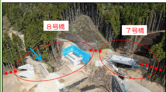
橋梁下部工工事(7号橋, 8号橋)