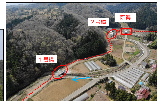
付替道路全景(1号橋~函渠)