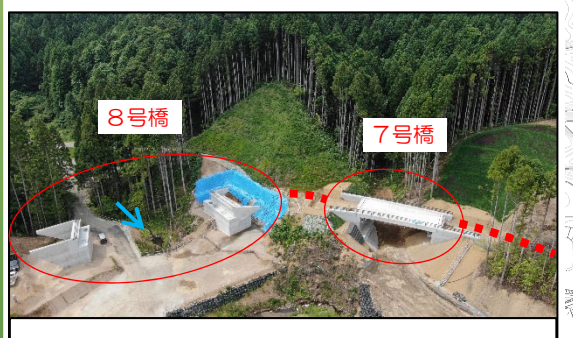
橋梁下部工事(7号橋, 8号橋)