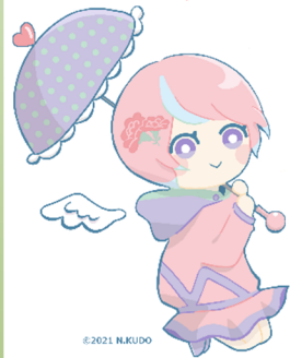
川内沢ダムイメージキャラクター「川内あい」

(R3補)道路改良工事(その4) 奥田建設(株) R4.4.11~R5.3.31 【進捗率 19%】 ⑨