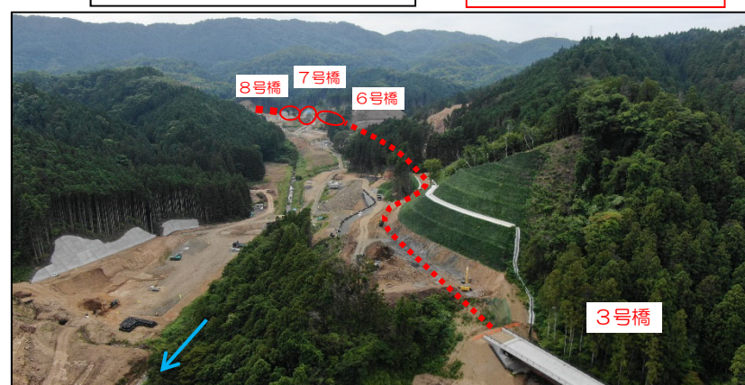
付替道路全景(ダム建設位置~8号橋)