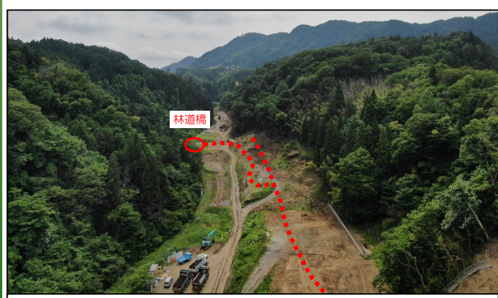
⑬(R3補)林道改良外工事

(R3)道路改良工事(その3) (株)深松組 R3.10.5~R5.3.24 【進捗率 36%】 ④