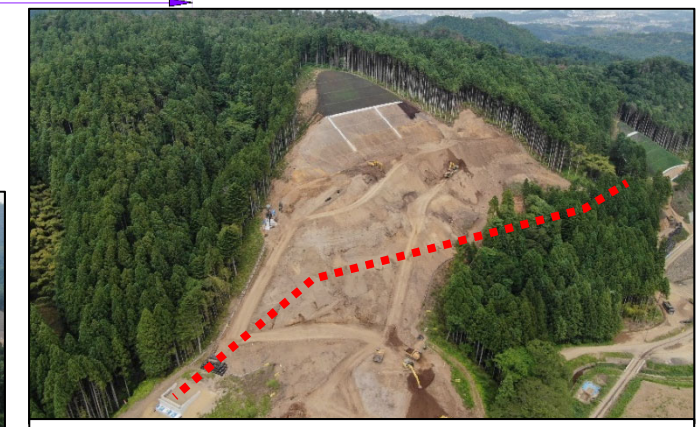
④(R3)道路改良工事(その3)