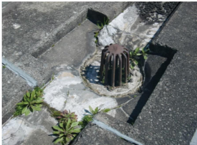
「排水ドレン」とは・・・ 雨水などを排水するための管や溝

汚れや詰まりがある場合は、スコップなどで取り除きます。危険な場所での作業となる場合は、教育委員会に連絡しましょう。