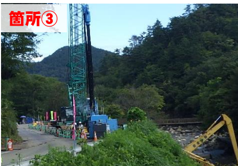
擁壁仮設土留め作業