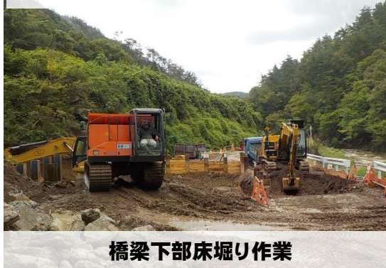
橋梁下部床掘り作業