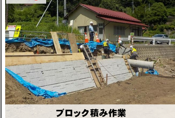
ブロック積み作業

1日も早く完成できるよう事業を進めてまいりますので、地域の皆様の御理解・御協力をお願いいたします。