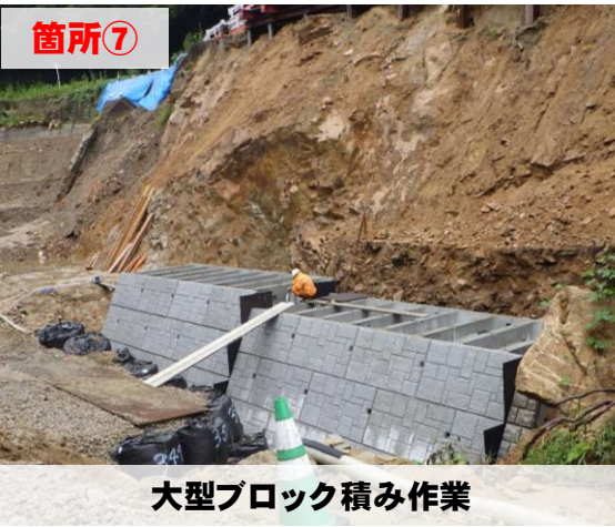
大型ブロック積み作業