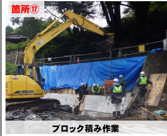
ブロック積み作業