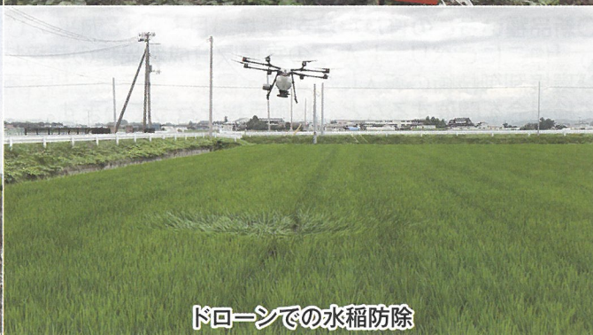
ドローンでの水稲防除