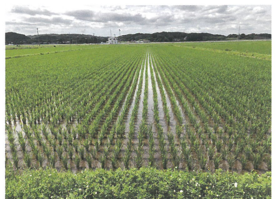
登米市に広がる田園風景

登米管内では約7,000haで環境保全米の作付けを行っており、これから春にかけて、土づくりに勤しむ方も多いと思います。このように土づくりを行って環境に配慮した農業を実践することが、SDGsの推進に繋がっています。「実は身近にあるSDGs」について、調べたり考えたりしてみませんか。