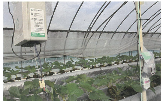
「にこにこベリー」展示ほに設置した環境モニター装置

JAみやぎ登米りんご生産部会を対象に、りんごの新しい仕立て方であるジョイント栽培について、技術支援を行っています。