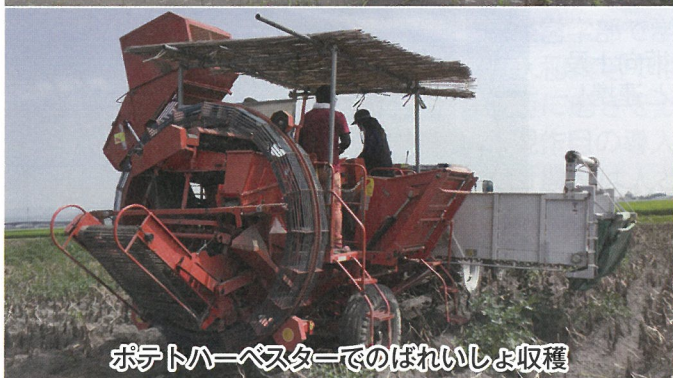
ポテトハーベスターでのばれいしょ収穫