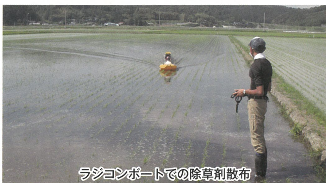
ラジコンボートでの除草剤散布

〒987-0511 宮城県登米市迫町佐沼字西佐沼150-5 TEL (代)0220-22-6111 FAX 0220-22-7522 E-mail : tmnokai@pref.miyagi.lg.jp URL : https://www.pref.miyagi.jp/soshiki/et-tmsgsin/