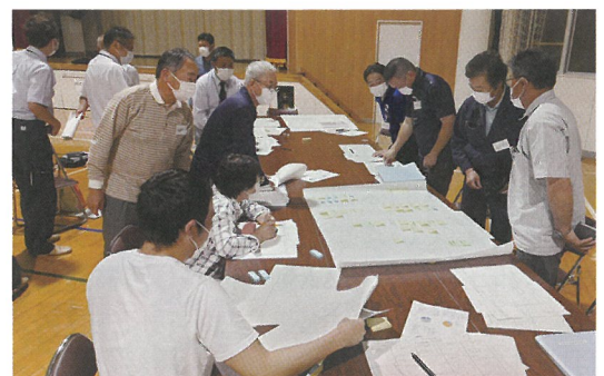
地域営農構想の作成に向けたワークショップ

農地中間管理事業の地域コーディネーターと連携しながら、担い手への集積・集約を目指している地域の活動を支援しています。