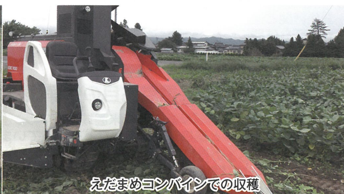
えだまめコンバインでの収穫