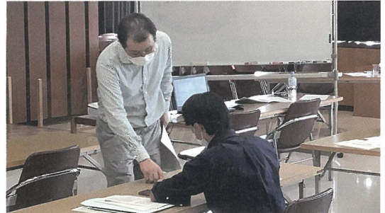
新規就農者向け研修会

関係機関と連携し、定期開催されている就農相談会において、スムーズな就農につながるよう、栽培に関する個別相談や就農計画の作成等を支援しています。