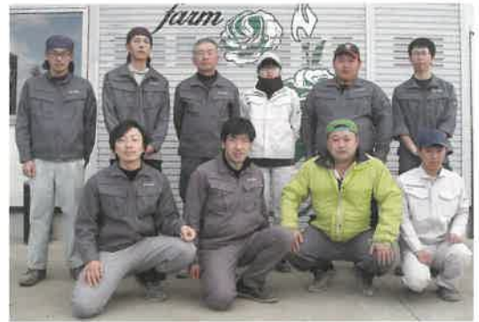
株式会社石ノ森農場のみなさん

規模拡大するきゅうり部門において、生産の効率化や生産体制づくりのため、生産やリスク等を管理するGAP手法の導入に向けた支援を行います。