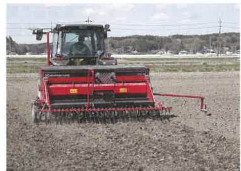
水稻乾田直播栽培の播種状況

令和元年度の自動飛行ドローンのオペレーターは30人であり、ドローンによる防除は水稻で410ha、大豆で159ha実施されました。今年度も引き続き、生育診断（空撮）や水位センサーのデータ活用、現地実証等を通じて省力化等に向けた支援を行います。