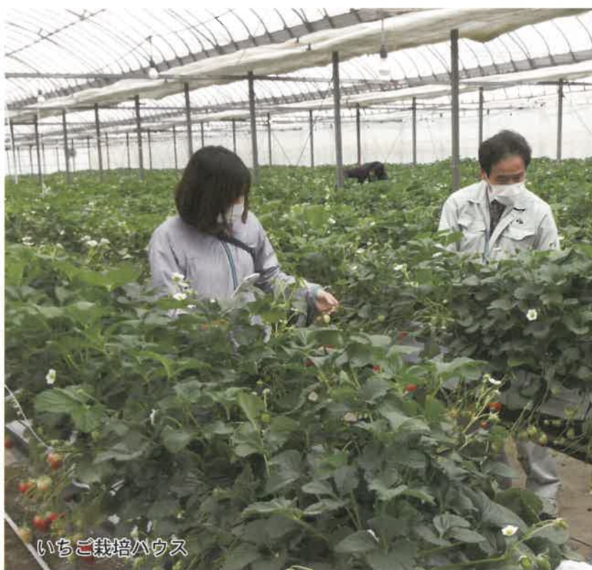
いちご栽培ハウス

〒987-0511 宮城県登米市迫町佐沼字西佐沼150-5 TEL (代)0220-22-6111 FAX 0220-22-7522 E-mail : tmnokai@pref.miyagi.lg.jp URL : http://www.pref.miyagi.jp/site/tmnokai