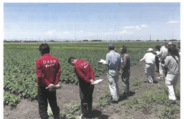
加工用ばれいしょの現地検討会

普及センターでは、県農業・園芸総合研究所及びカルビーポテト株式会社と連携し、生産性向上に向けた技術支援を行います。