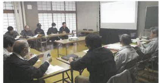
技術導入の検討会

環境測定機器導入実証ほの実践状況や当技術に関する基礎知識等を情報紙にまとめ、導入効果や実践のポイント等の知識の習得を支援します。