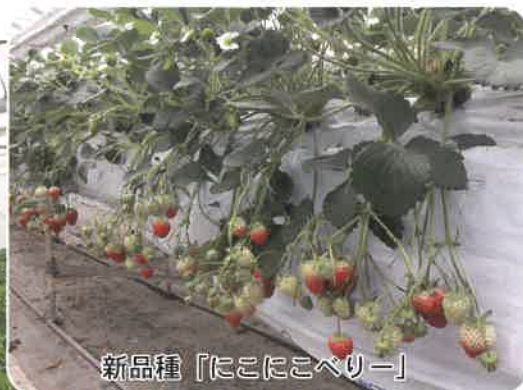
新品種「にこにこベリー」