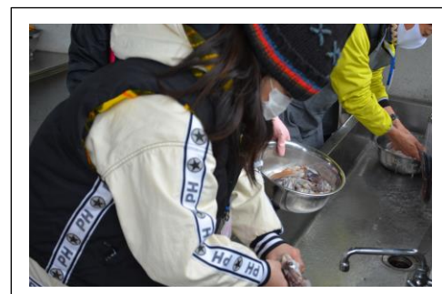
寒さに負けず、イカの下ごしらえ