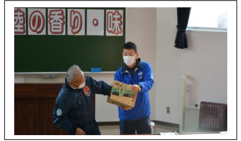
大抽選会！大当たり！？