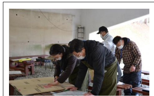
寒さに負けず、くん製箱作り