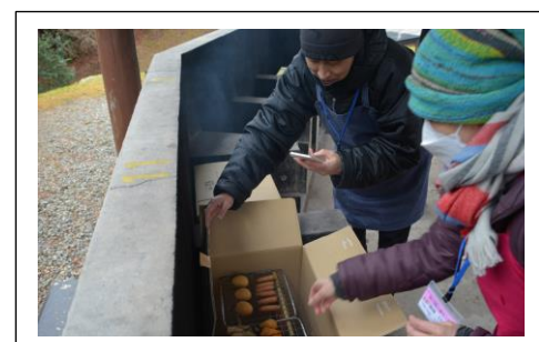
おいしそうなくん製