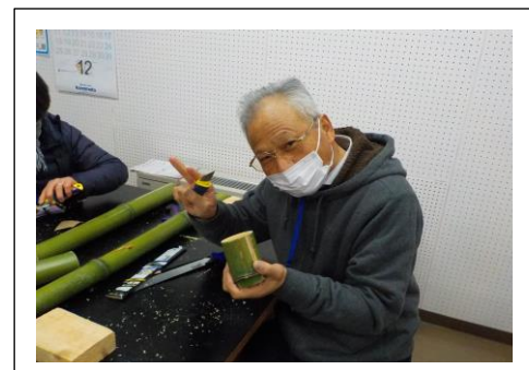
竹でコップを作りました