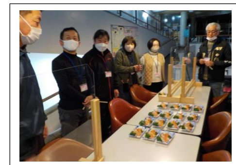
スモークサーモンの試食会