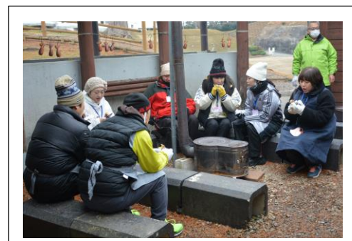
ほくほくとした焼き芋。おいしい！