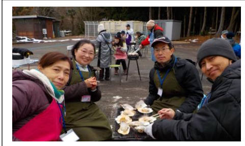
自分でむいた牡蠣とほたては最高！