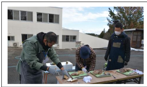
上手に牡蠣とほたてむきができました！