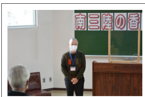
開講式（参加者代表挨拶）