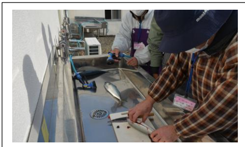
おいしそうな鯖です