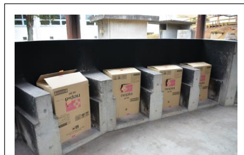
くん製箱が勢ぞろい