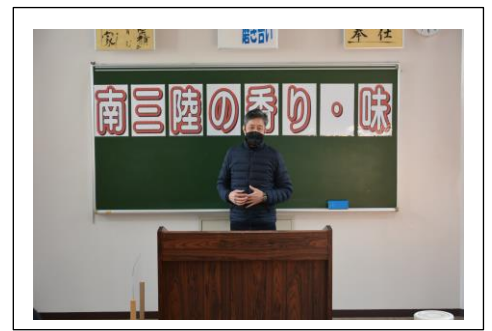
閉講式（参加者感想）