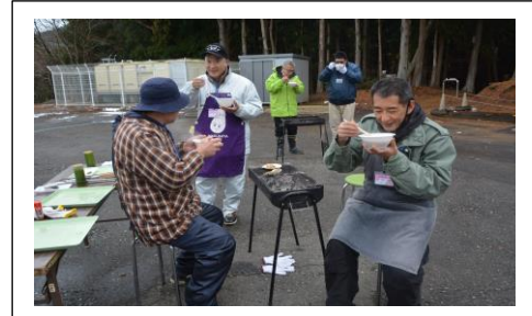
海鮮鍋を食べてぽかぽか