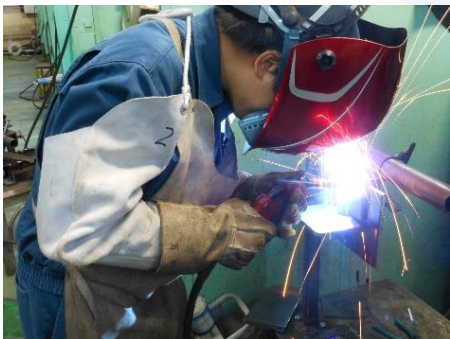
アーク溶接の訓練風景。電気を使用することによって、非常に高い温度になるため、さまざまな金属を溶接できる。

Aさん:技術はどんどん進歩していくでしょうが、それによって技術者が不要になることはないと思います。まず、AIや機械学習ですが、開発するコストが膨大にかかることを考えると、何もかも機械が独力で行うようにはならないでしょう。