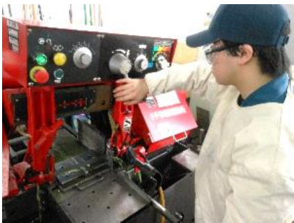
金属は曲げたり伸ばしたりできる。機械を操作して、思ったような形に曲げる訓練を行う。

Aさん:従業員にどのくらいの賃金を払えるかは、その企業の収益性によりまます。どこでもできる技術しか持っていないと価格競争になりますから、収益性が低くなり、従業員に低い賃金しか払えません。「この仕事はここに頼むしかない」という技術を持った企業なら、収益率が高く、従業員の賃金も高くなります。一例をあげれば、医療機器や、半導体製品を製造する機器をつくらせているような企業は収益率も高いです。高技専の指導員はそのへんの事情も分かっているはずで、就職指導もきちんとしてくれているはずですから、もちろん、「いい企業」に入るには、動かしや技術向上への熱意が必要です。「腕次第で稼げる」のが金属加工のよいところだと思います。